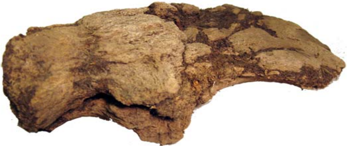
Fig. 5 Vänster del av pannbenet (os frontale) med skallfast horn (cornu) från kronhjort (Cervus elaphus).

Då både älg och kronhjort visar färdigbildade skallfasta horn kan man sluta sig till att de nedlades någon gång mellan sensommaren och tidig vinter. Vilket i månader räknat blir ungefär augusti till och med november.