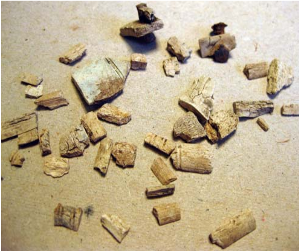
Fig. 7. 37 Kamfragment funna i grav A2 tillsammans med ben från en hund.

Frågan om hur man ska tolka frånvaron av människoben i graven i Fotingen, kan i och med fyndet av en kam ställas på sin spets. Om graven var tillägnad en hund hade förmodligen hunden inte fått med sig en kam som gravgåva, eftersom man ofta förknippar just själva gåvan med individen i fråga. Att det är fråga om ett litet barn vars ben helt försvunnit går självklart inte att utesluta. Ser man lite längre söderut, kring Mälardalen, förekommer det ett århundrade tidigare att barn fått med sig kammar i graven (Brynja 1998). Det kan därför inte uteslutas att detta också förekommit i församiska kontexter. En annan trolig tolkning av graven att det rör sig om en kenotaf tillägnad en person som omkommit på annan ort och inte varit möjlig att frakta till begravningsplatsen. Kanske tillhörde hunden den avlidne och fick offras i dess ställe och kammen kan tänkas ha tillhört den döde och fick representera personen i graven i egenskap av att ha varit en personlig tillhörighet. En tredje möjlighet är att det faktiskt finns en begravd människa i stensättningen men att benen från personen är allt för fragmenterade för att kunna identifieras.