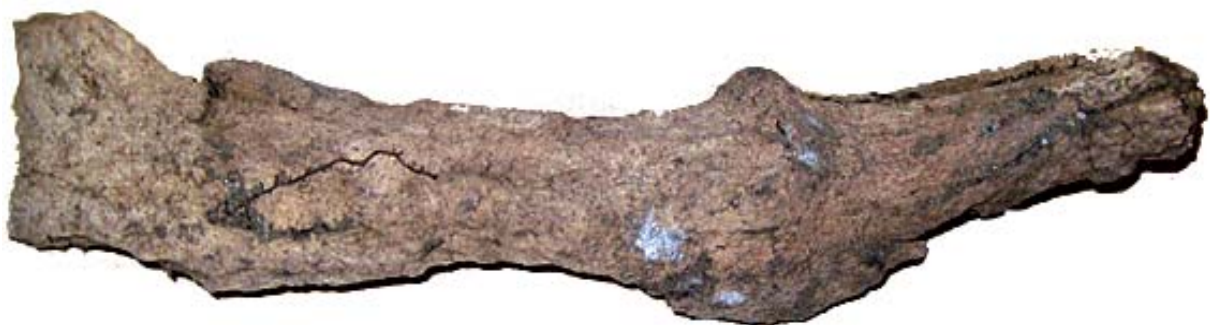
Fig. 6 Vänster del av pannbenet (os frontale) med skallfast horn (cornu) från Älg (Alces alces).