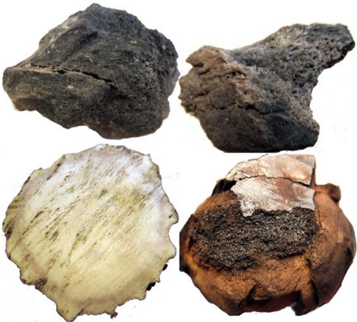
Figur 3 Jämförelse med brända älghorn från Fotingen överst kontext B4 t.v. B8 t.h. och färskt älghorn nederst t.v. obränt, t.h. bränt. Notera hur framträdande spongiosan ter sig i de brända hornen.

Med anledning av svårigheterna att identifiera små fragment av brända horn har jag utfört försök på färsk horn från olika hjortdjur. Hornen har svetts i en eldstad under varierad tid för att se hur strukturerna framträder och förändras med bränningstid och temperatur. I figur 3 nedan visas exempel på hur spongiosan i älghorn framträder i och med förbränning. Det har dock inte gått att simulera den ytterligare uppluckringen som sker av lamellerna, eller nedbrytning av ytskiktet, som sker med lång tid i jorden.