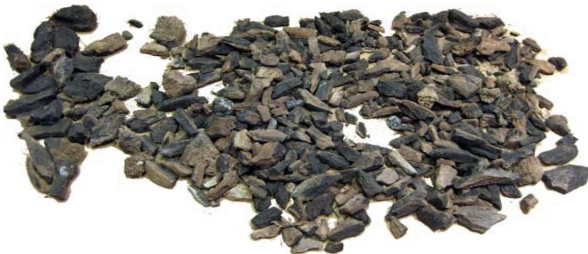
Figur 2 Urval av svedda hornfragment från kontext B3

bestämmas uppvisar exakt samma struktur som de bestämningsbara men är för små för att man ska kunna få en helhet i formen. I de fall ytskiktet är bevarat påminner de mycket om älg och kronhjort men har en för skrovlig yta för att kunna härstamma från ren.