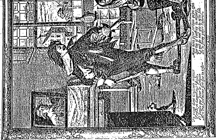
MICHEL FOUCAULTS "Sexualitetens historia", varav andra delen "Njutningarnas bruk" i dagarna utkommit på svenska, beskriver bl a synen på sexualiteten i antiken, där den fria mannen för att kunna härska i hemmet och staten först måste kunna

Om man någon gång lyckats ta sig igenom de tabellrapporter och forskningsrapporter som ofta blir resultatet när forskare och s k avnärare - SAF, LO, Konsumentverket t ex - fusionerar, då kan man jämföra vad den