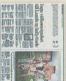
Sydsvenskan, torsdag 21 juli 2011.

ESS, European Spallation Source, är en forskningsanläggning i vilken man med neutroner undersöker hur material är uppbyggda. ESS ska byggas på Brunnshög i nordöstra Lund och beräknas tasi i drift 2019.