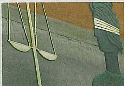
"Rättvisan är blind" är en metafor för rättsväsendets opartiskhet.