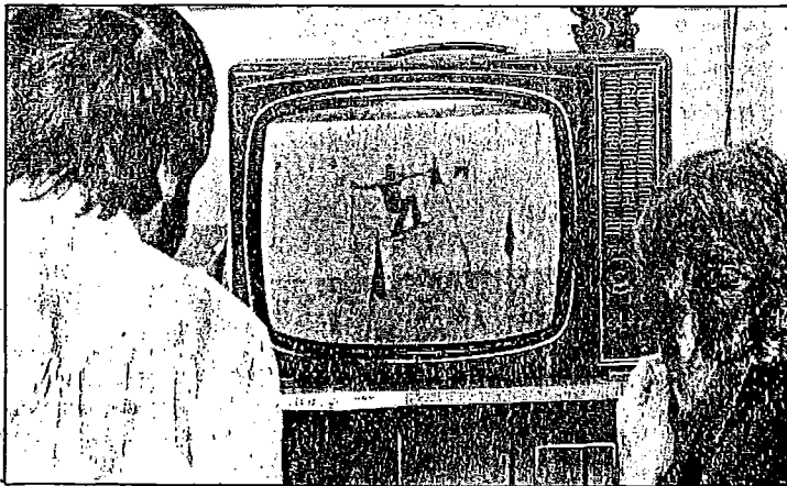
Många ser få.