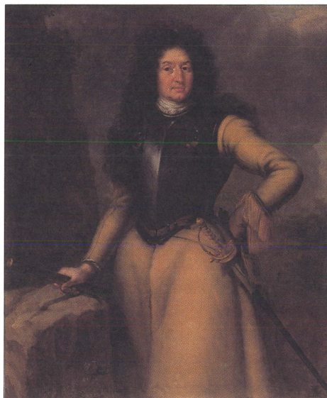
David Klöcker Ehrenstrahl, Axel Wachtmeister

Karl XII:s generaler finns som diskuterats ovan kvar på Drottningholm, men porträtten av Karl XI:s generaler och rådsherrar är placerade på andra håll. Några av generalsporträtten hänger tillsammans på Karlberg, men det är svårt att där få en uppfattning av den ensembleverkan de bör ha haft på Drottningholm. En bild som reproduceras tas naturligtvis alltid ur sitt sammanhang, men i fallet med de karolinska porträttserierna är en sådan isolering särskilt missvisande. Anledningen är att karolinerporträttens effektivitet som bilder till mycket hög grad