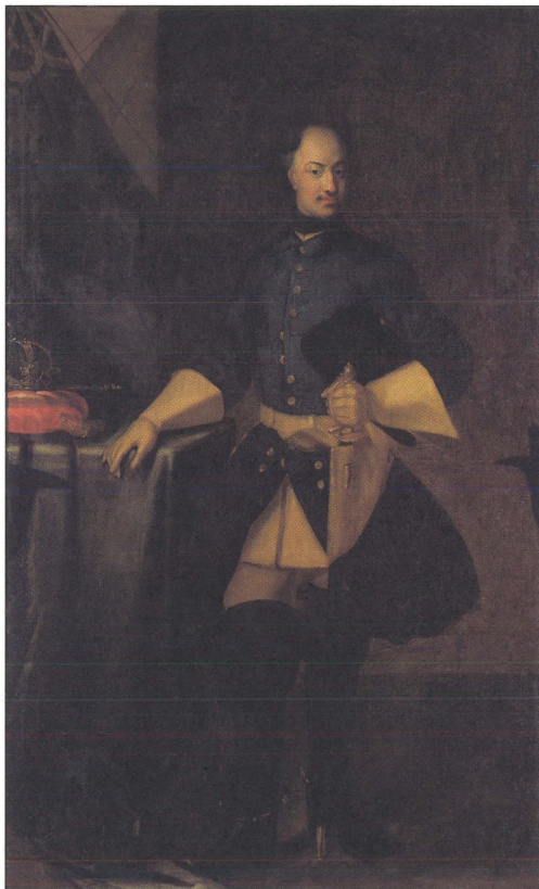
David von Krafft, Karl XII

Historiker talar ibland om Karl XII-renässansen för att beteckna den politiska rörelse som under 1910-talet var emot nedrustning, parlamentarism och kosmopolitism. Samlande händelser var Borggårdskrisen 1914 och Karl XII-jubileet 1918. 3 Även om första världskriget till stor del raserade grunden för Karl XII:s symbolvärde fortsatte de svenska hjältekungarna att fascinera historiker och allmänhet, långt därefter.