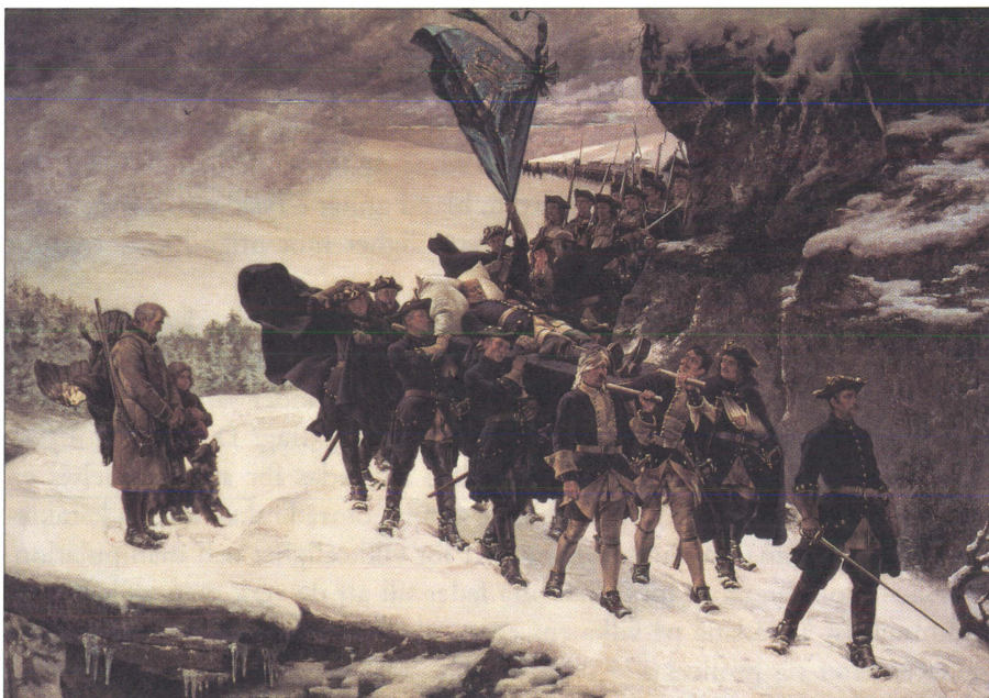
Gustaf Cederström, Karl XII:s likfärd