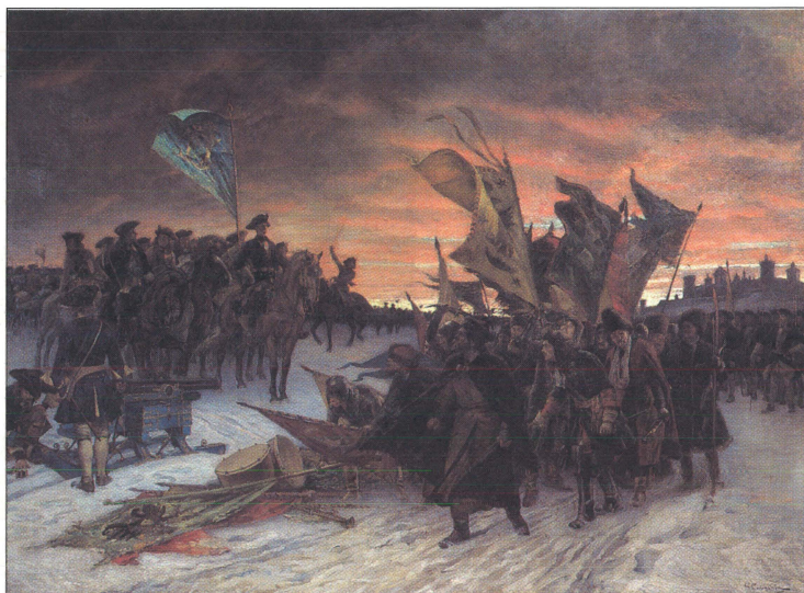
Gustaf Cederström, Slaget vid Narva