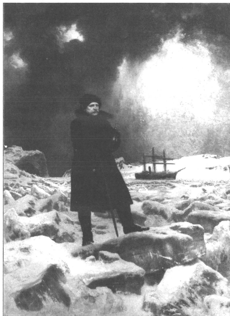
BILD 4: Upptäcktsresanden A. E. Nordenskiöld. Målning av Georg von Rosen. Olja på duk. Nationalmuseum.