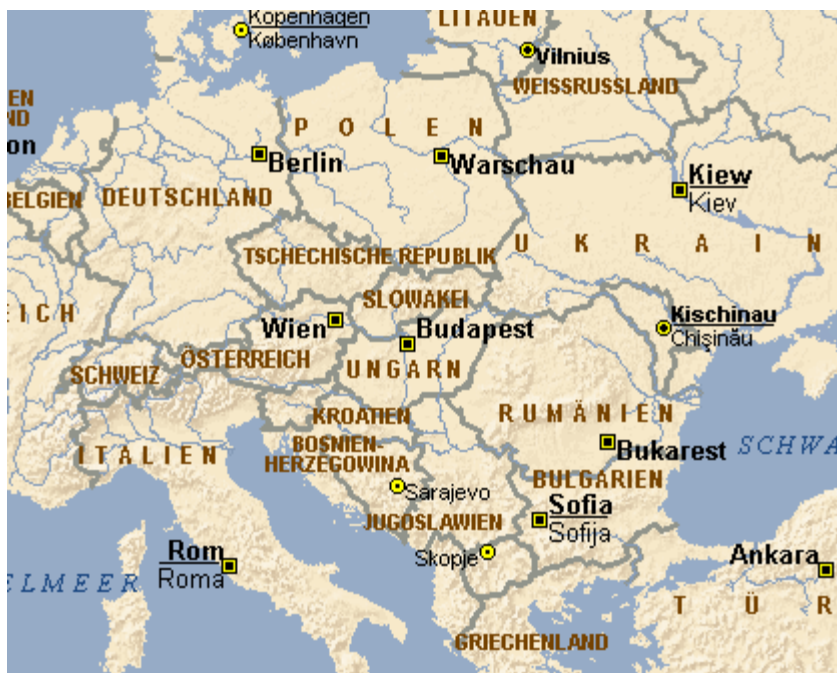
Bosnien-Herzegovinas placering i Europa.