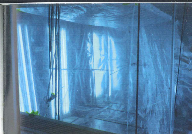
Smogkammaren, metoden som åldrar luft.

Om partiklar som vi andas in fastnar i våra luftvägar beror framför allt på deras storlek. En färsk sotpartikel är mindre än en åldrad och fastnar därför lättare i lungorna och i luftvägssystemet. Åldrade partiklar är större än färska eftersom de är belagda med andra ämnen som kan ta upp vatten och svälla, exempelvis i de fuktiga lungorna. Det innebär att hälsoeffekterna kan vara olika be-