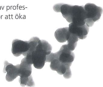
Färsk sotpartikel.