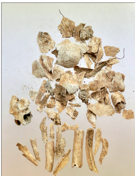
Figur 17. Brända benfragment av ett litet barn från urnegrav 1.

Carl Gyllenstiernas anteckningar spelar en stor roll i vårt arbete att finna uppgifter om försvunna platser och ingrepp i högar. Äldre kartmaterial och sockenbeskrivningarna ger in-