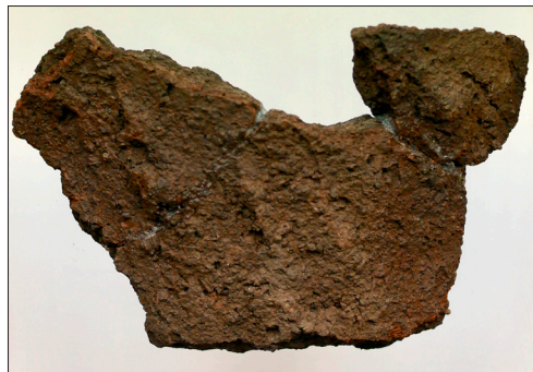
Figur 4. Rödbrun rabbig bronsålderskeramik från urnegrav 1.

Graven fanns i den sydvästra kvadranten av röset och bestod av en liten kista av flata hällar (Figur 3). I kistan fanns skärvor av ett lerkärl samt brända ben. Det fanns tre bottenbitar och flera så kallade buxskärvor samt en svagt utsvängd mynningsbit med en liten knopp strax under kanten. Godset var rödbrunt, grovt magrat med en rabbig yta med dekor av dragna fingrspår (Figur 4). Lerkäret går inte att rekonstruera, men det har karaktären av traditionell yngre bronsålderskeramik.