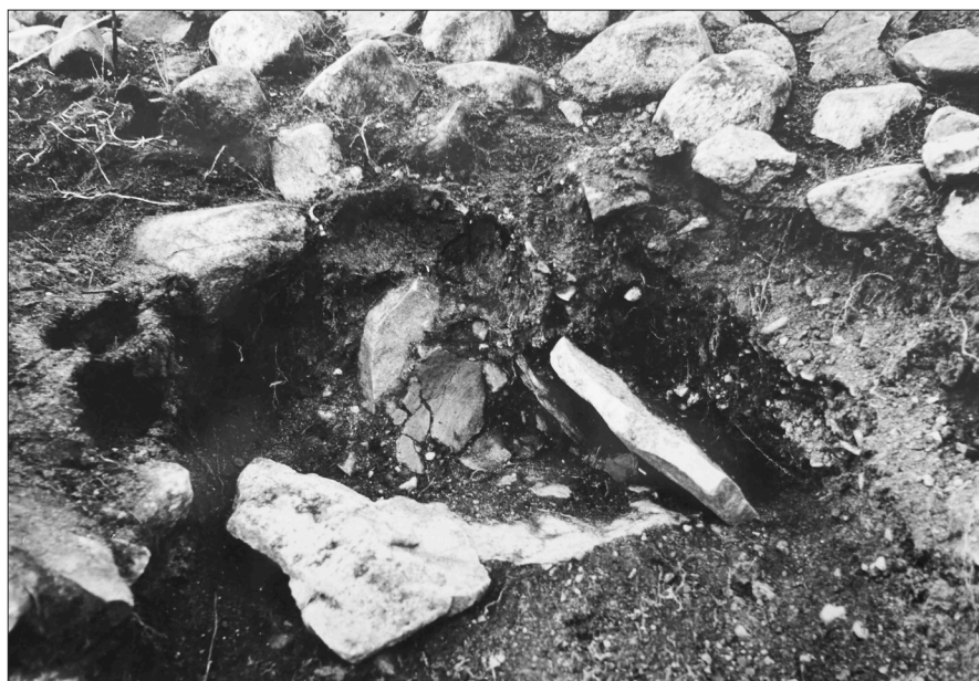
Figur 10. Urnegrav 4 vid utgrävningen.

Graven låg i kanten av den nordöstra delen av röset. Den bestod av en kista med delvis bevarade sidohällar och en bottenhäll, som var något nedgrävd i moränen (Figur 10). Kistan var invändigt sotfärgad och innehöll brända ben och keramikskärvor. Skärvorna, varav en mynningsbit, är av rödbränt gods, grovt magrat och har en rabbig yta. Keramiken kan även i denna grav dateras till den senare delen av yngre bronsåldern.