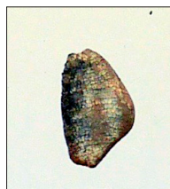
Figur 11. Tandkrona troligen från urnegrav 4. Emaljskador har uppstått vid upprepade tillfällen. Barnet har troligen drabbats av svält.

De brända benen i en fyndenhet kan föras till ett barn, som var 4–6 år gammalt. En obränd tandkrona har identifierats. Om tanden är en hörntand, vilket är troligt, är barnet minst cirka 6 år, eftersom tandkronan är färdigbildad (Figur 11). 5 Också förekomsten av emaljhypoplasier talar för att det är en hörntand. Sådana skador, som uppstår då emaljen bildas, är ofta särskilt tydliga på permanenta hörntänder.