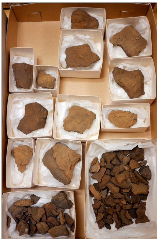
Figur 8. Keramikskärvor från urnegrav 3 uppsorterade i magasinet.

I graven hittades två vårtutskott (Figur 9). De är ett muskelfäste bakom örat. Ett utskott är stort och kraftigt