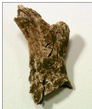
Figur 2. Ansiktsfragment, intill ögonhålan från anläggning 1.

Anläggning 1 bestod av en flat sten, som påträffades i den sydöstra kvadranten, alldeles i rösets kant. Ett sotigt lager med brända ben omgav stenen och ett par små samlingar av brända ben hittades intill. De kan höra samman. Benfynden består till övervägande del av extremitetsben, men också kranie- och ansiktsfragment ingår. På figur 2 syns ett benfragment, som suttit intill ögonhålan. Människan har avlidit i vuxen ålder. Också delar av ett mellanstort djur har bränts.