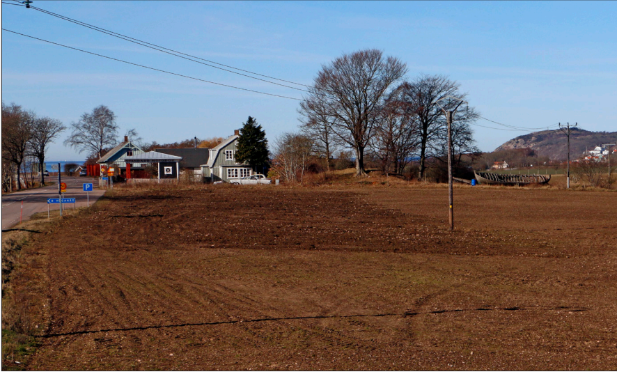
Figur 16b. Hässlehögen i Möllehässle.

tor för att konstruera graven. Gravsättningen och förslutningen av graven efter kremeringen innebar ytterligare arbetsinsatser, liksom att vårda gravområdet. Ritualerna för att gravsätta familjemedlemmar krävde ett kollektiv, som kunde fortsätta de traditionella ritualerna eller att förändra dem. Precis som idag.