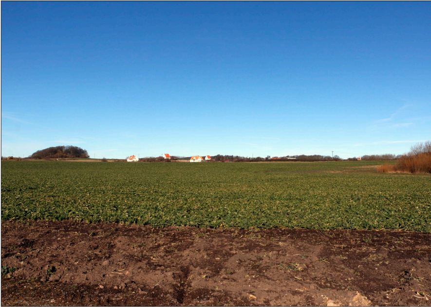
Figur 1b. Pangs hög är borta idag. Den låg strax vänster om buskaget till höger. Kullen till vänster är Lunnebjär vid Brunnby.

hade sparkat upp kanterna i framförallt den östra delen. Den var beväxt av några mindre träd och buskar (Figur 1a). Höganäs stad hade år 1957, i samband med karteringsarbete, grävt ner en triangelpunkt i högens topp. Högen undersöktes under sensommaren och hösten 1966 av arkeologer från den arkeologiska institutionen i Lund. 3