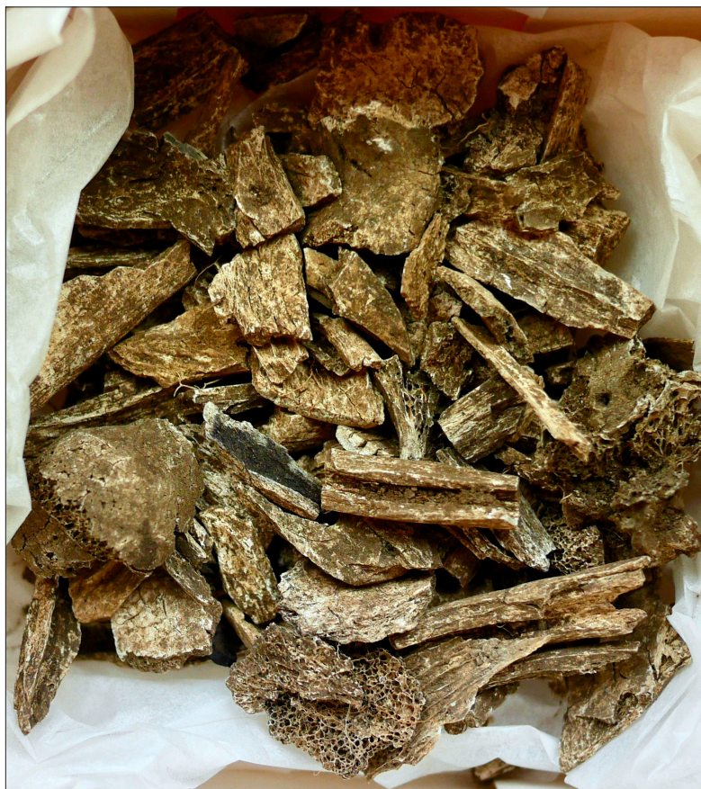
Figur 5. Brända ben från urnegrav 1.