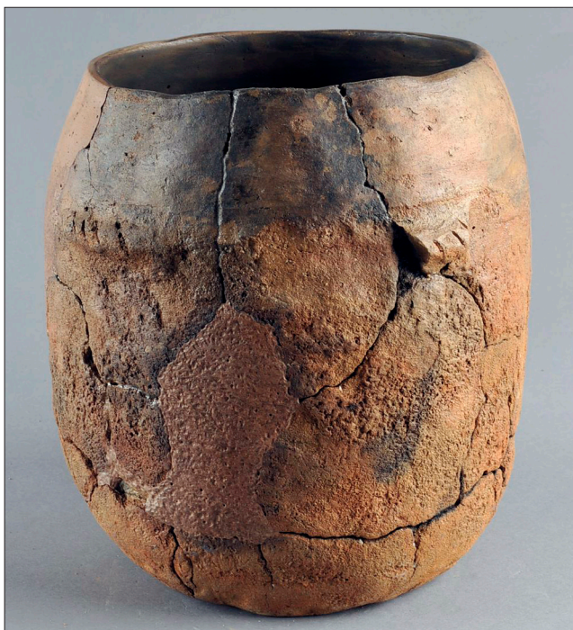
Figur 16a. Möjligen kan något av lerkärlen i Pangs hög likna detta kärl. Det kommer från en grav i Gråmanstorp, Klippan (SHM11 359).

Denna bronsåldersgrav har troligen legat nära en gård och dess ägor. Fynden är relativt enkla och består huvudsakligen av keramik. Detta är vanligt under denna tid. Att det inte fanns bronsföremål i gravarna tror vi beror på att bronsstillförsel till Kullabygden inte har varit stor. I andra områden i Sydskandinavien var det vanligt att under denna tid lägga värdefulla bronsföremål i gravar.