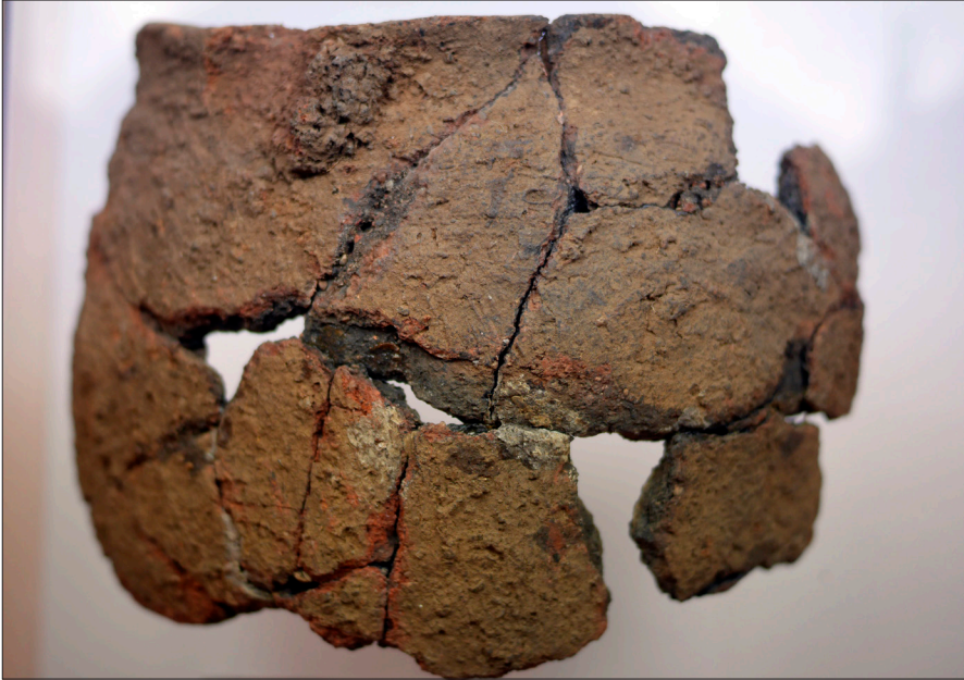
Figur 18. Lerkärllet som innehöll de brända benen från urnegrav 1.

dikationer på nu försvunna högar liksom att Geologiska Byrån, då man karterade Brunnby socken på 1850-talet, också registrerade förekomsten av högar. I detta avsnitt återger vi dessa anteckningar och iakttagelser som berör den yngre bronsåldern och som kan relateras till vår undersökning av Pangs hög i Rågåkra.