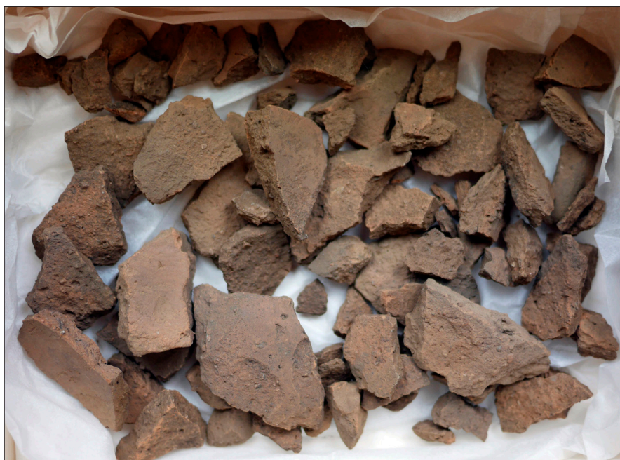
Figur 7. Skärvor av från det kraftigt fragmenterade lerkärllet i urnegrav 2.