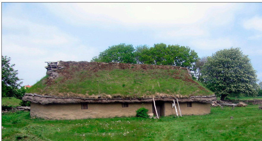
Figur 20. Rekonstruerat bronsålderhus i Boarp på Bjäre. Foto: Kristina Jennbert 2006.

Vi känner inte till några hus eller gårdar från bronsåldern i Kullabygden. Det rekonstruerade huset från Boarp ger en bild av hur ett bronsålderhus kan ha sett ut (Figur 20). Från andra områden visar arkeologiska studier att det i början av bronsåldern skedde en expansion av landskapsutnyttjandet främst beroende på utökade arealer för bete. Spår efter ärgning på ursprungliga markytor under gravhögar visar att man använde årdar för att luckra upp jorden, vilket gav ett mer effektivt jordbruk. Odlingen av de tidigare vete- och kornsorterna fortsatte under bronsåldern, men nu infördes också havre, hirs och bönor.