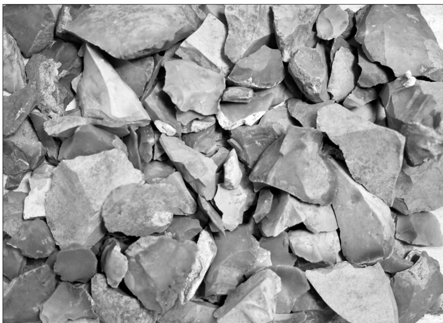
Figur 15. Flintor från röset.

Genom att återigen gräva, men i magasinet, kan vi öka kunskapen om Pangs hög. Nu kan vi säga att ett relativt stort antal människor gravlagts i detta jordblandade röse. Såväl vuxna individer som yngre och äldre barn har begravts. Endast de allra minsta, spädbarnen, har inte begravts här så att de kan återfinnas. Å andra sidan är högen skadad och våra slutsatser grundar sig på de anteckningar som gjordes under utgrävningen. Vi har bedömt att några av de bensamlingar som hittats