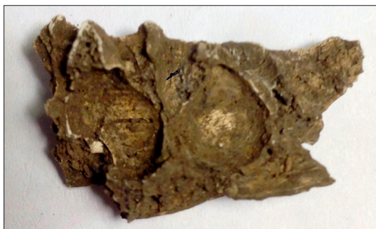
Figur 12. Bränt underkäksfragment av ett barn sannolikt från urnegrav 4. Man kan se avtryck efter både mjölkttänder och permanenta tänder (tandkronor).

Benen i ett närliggande fynd visar att där också finns delar av ett barn. På ett underkäksfragment syns att mjölkttänder varit utbildade. Alveolerna för tändernas rötter syns tydligt. Under dessa finns håligheter för hela tandkronor där två permanenta tänder börjat bildas. De ligger under två tänder med dubbla rötter. Därför bör de bildade kronorna vara P1 och P2. Individens bör därför ha dött vid 7–8 års ålder (Figur 12).