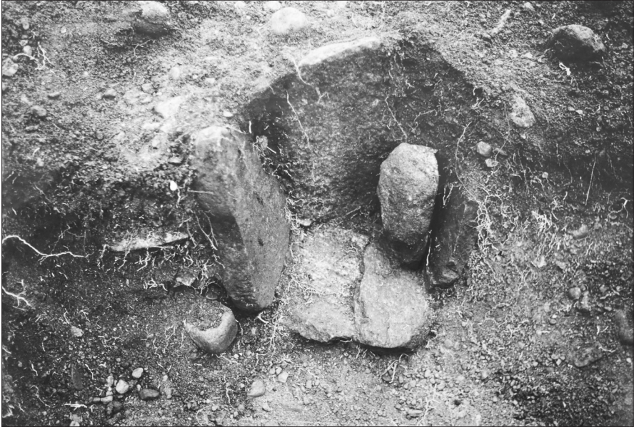
Figur 3. Urnegrav 1 vid utgrävningen.