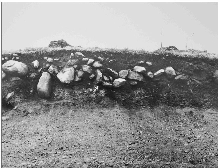
Figur 6. Den väst-östliga profilen genom högen. Urnegrav 2 är markerad med en pil.