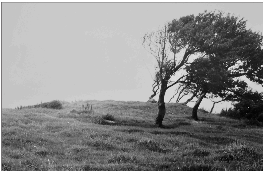
Figur 1a. Pangs hög från söder före undersökningen 1966.

Högen låg i betesmark, som hade brukats cirka 25 år tidigare. Den syntes som en svag förhöjning och den var svårt skadad av betande djur, som