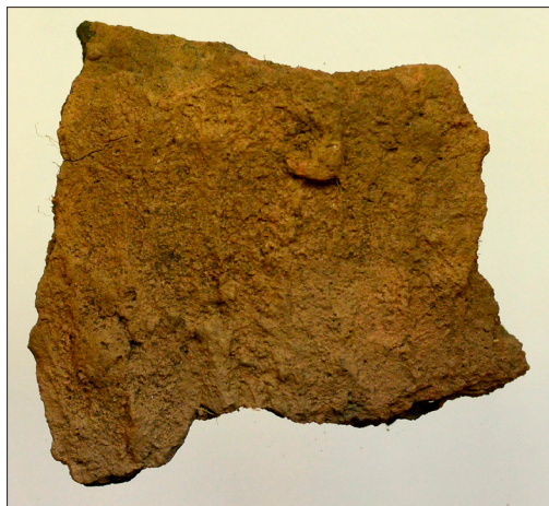
Figur 13. Keramik dekorerad med "dragna fingrar" i den rabbiga ytan från urnegrav 5.

Graven med en bottenhäll var något nedgrävd i moränen. Den påträffades i den nordöstra delen av röset. Keramik och de brända benen låg på bottenhällen. Keramikskärvorna, varav 4 bottenbitar, är av ljusbrunt, grovt magrat gods. Godset är dekorerat med vertikalt ”dragna fingrar” i den rabbiga ytan och kan dateras till den senare delen av den yngre bronsåldern (Figur 13).