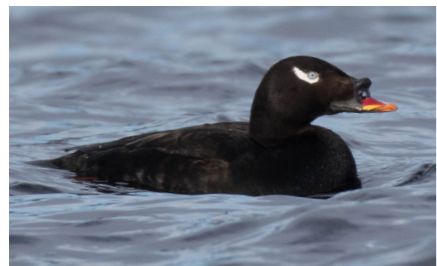
Sibirisk knölsvärta Melanitta stejnegeri utanför Umeå i maj 2018.