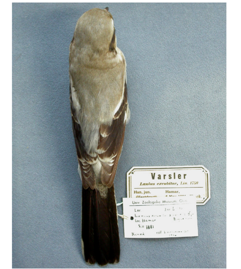
Beringvarfågel Lanius borealis sibiricus .