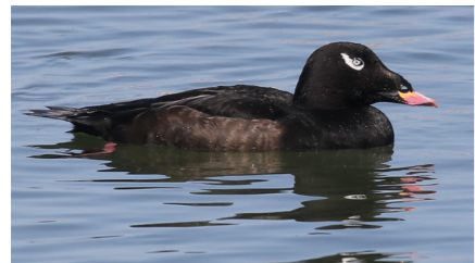
Amerikansk knölsvärta Melanitta deglandi fotograferad i Seattle på den amerikanska västkusten.