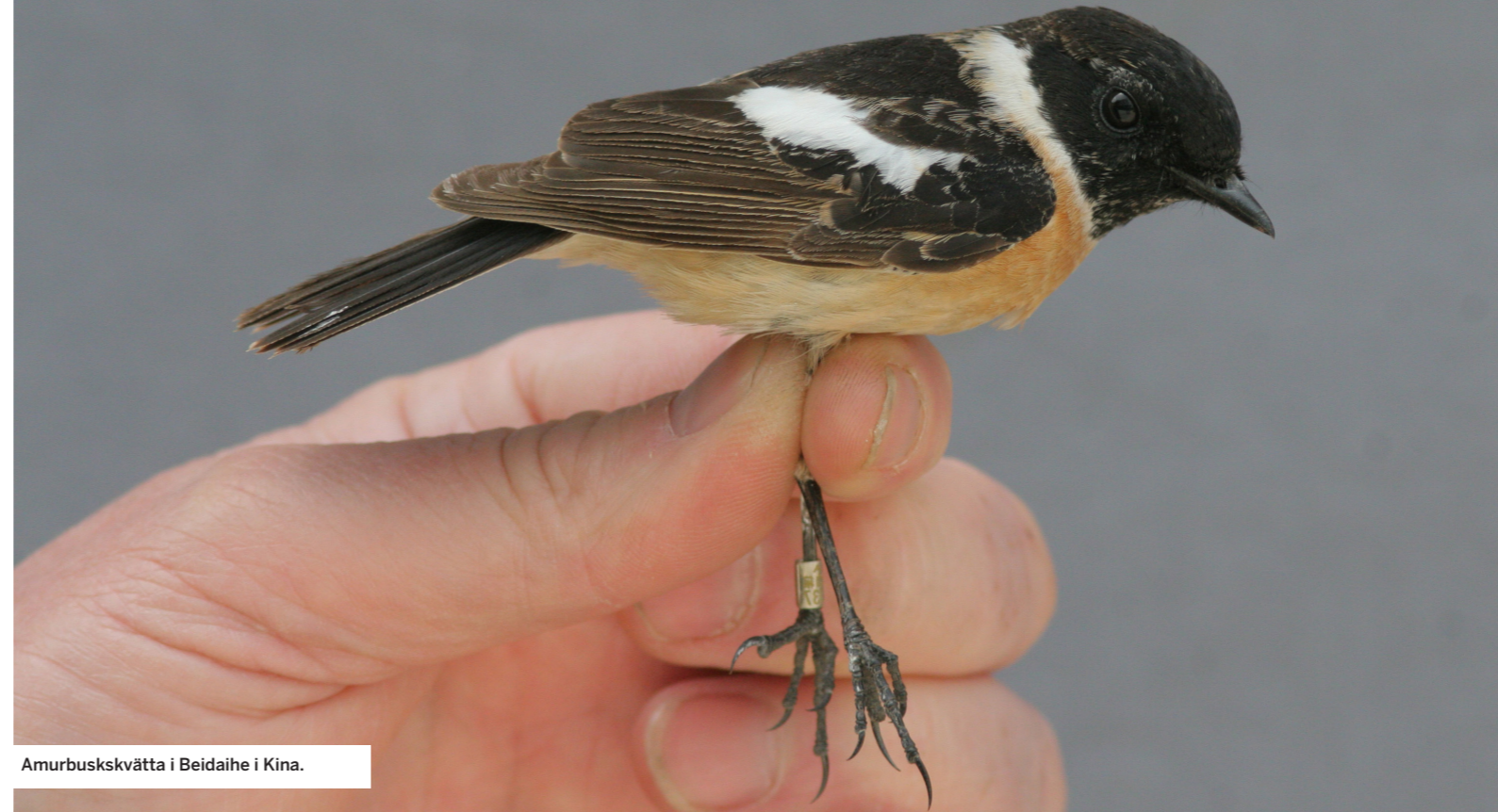
Amurbuskskvätta i Beidaihe i Kina.

Förändringar i komplexet RÖDKRONAD LÄRKA . Enligt VP-listan förekommer i Jemen och sydvästra Saudiarabien rödkronad lärka Calandrella cinerea av rasen eremica . Genetiska studier visar dock att