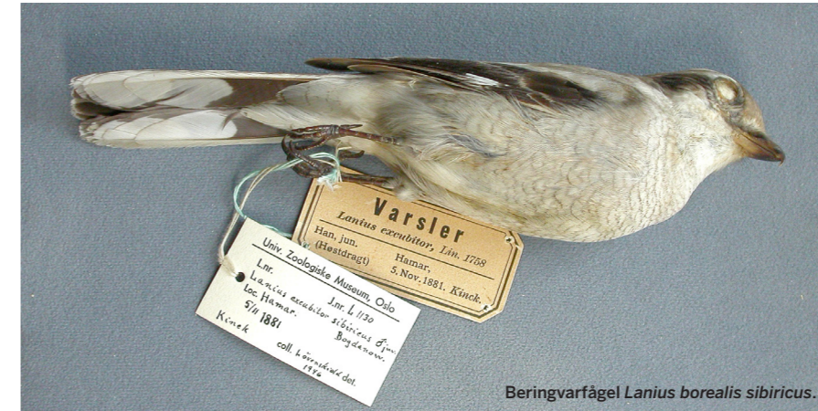
Beringvarfågel Lanius borealis sibiricus .

som bör särskiljas, och dessutom har studierna saknat molekylära data för många raser. Tk valde därför att 2017 tills vidare bordlägga en uppdelning.