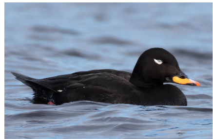
Svärta Melanitta fusca utanför Umeå i maj 2018.