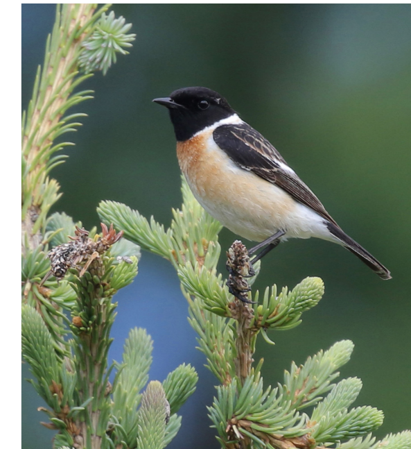
Vitgumpad buskskvätta, Altaj, Ryssland.

Arten, som är monotypisk, förekommer från centrala Sibirien österut genom nordöstra Kina och Koreanska halvön till Sachalin och Japan. Trots de nu publicerade studierna kvarstår fortfarande många frågor om komplexet, inte minst kring hur de asiatiska raserna przewalskii och indicus passar in i pusslet. Det finns också ett behov av fältstudier i Transbajkal där maurus möter stejnegeri , men ingen av dem verkar förekomma söder och öster om Bajkalsjön eller i Selengaflodens delta vilket indikerar att gränsen mellan de två arterna kan vara abrupt.