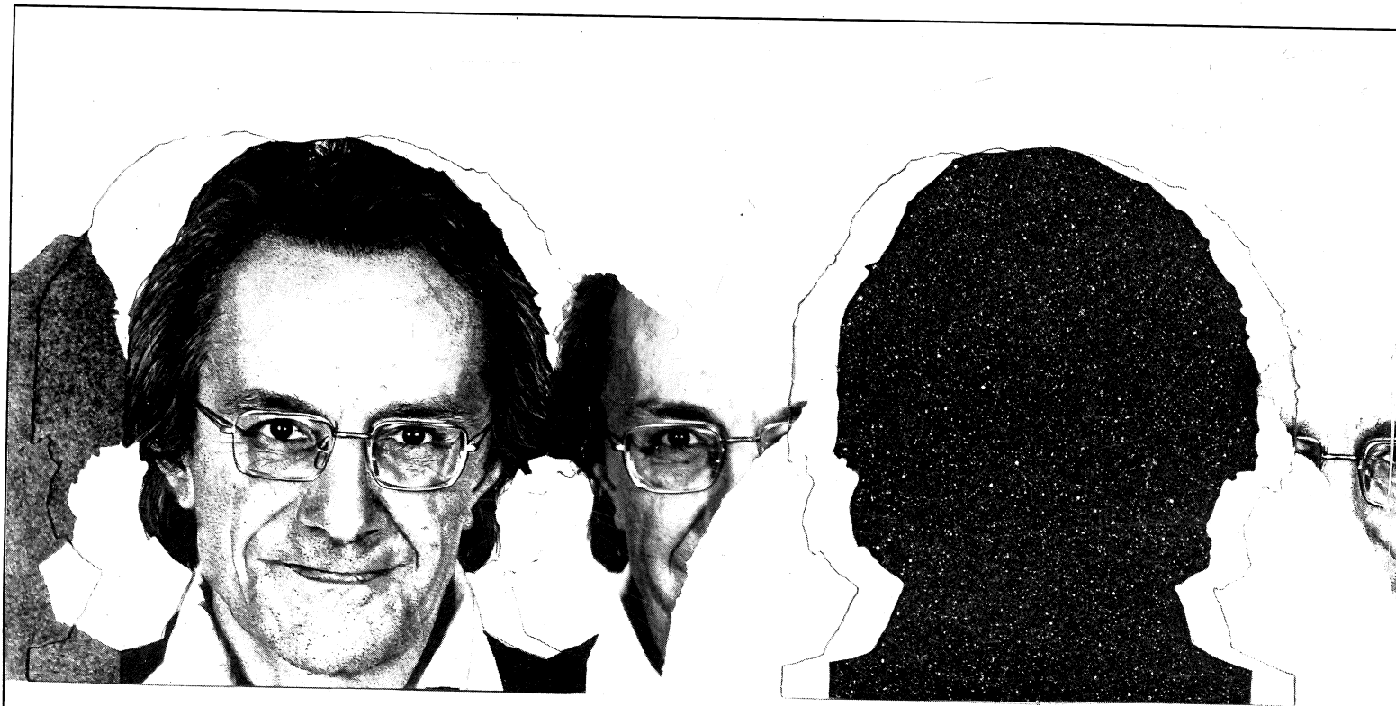
Musée d'art Modernes samlingar, Strassburg

– Nej, 'det sublimes' är snarare en inställning. Men det man skulle kunna kalla det sublimes estetik har en mycket lång historia, den börjar ungefär vid vår tideräknings början. Det är absolut