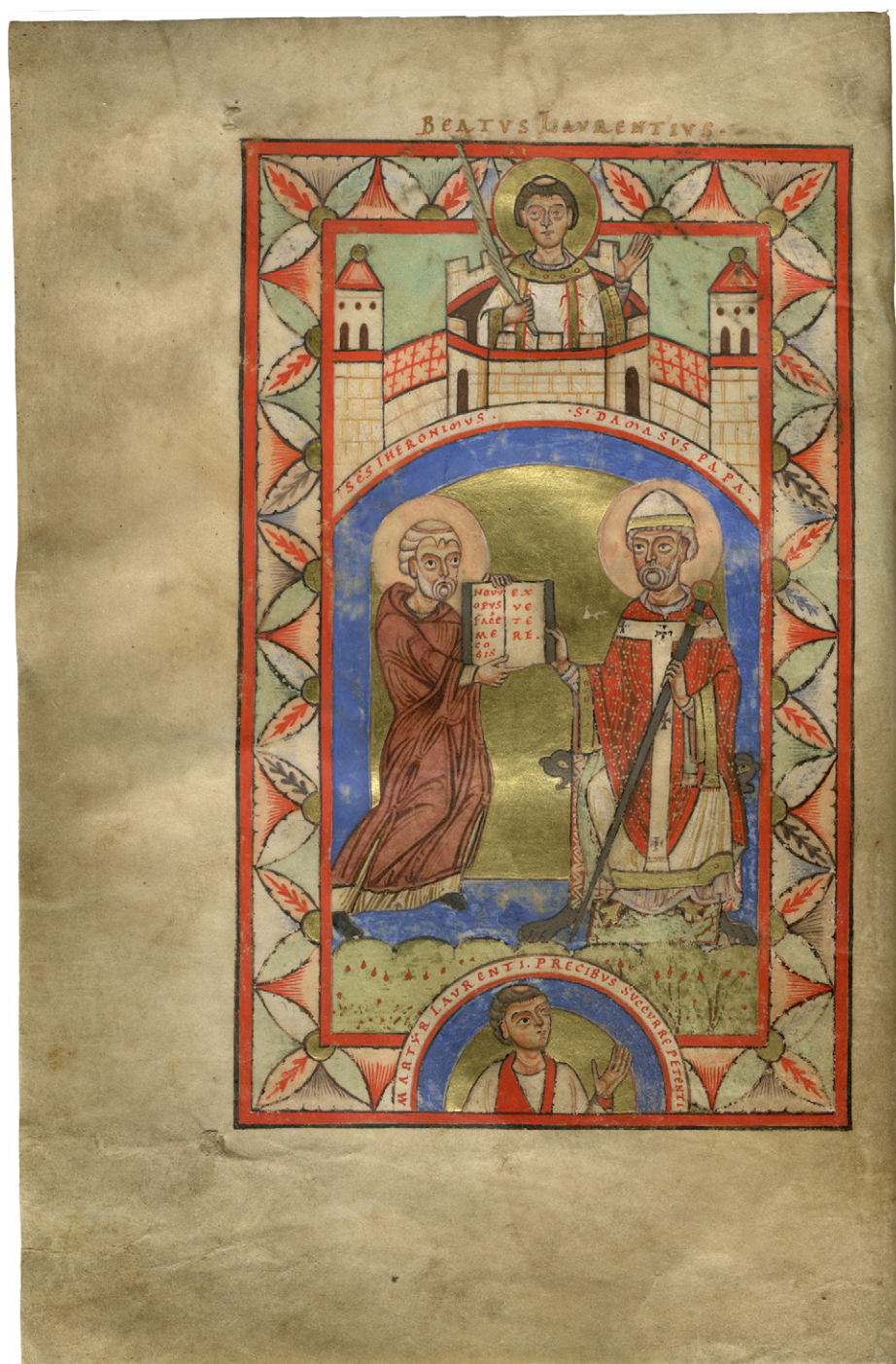
Bild 11. UUB ms C83, fol. 1v. Evangelium framställt för Lunds domkyrka i Helmarshausen ca. 1140. Dedicationsbild med Hieronymus som överlämnar bibelöversättningen till påven Damasus i mitten, samt givaren av handskriften i nedre halvcirkeln och mottagaren, dvs. St Laurentius i den övre stiliserade bilden av Lunds domkyrka.

dödas dödsdagar, om det finns sådana för dagen, och hela församlingen skall för deras skull tillgivet sjunga psalmen De profundis . Pater noster . Svaret. Låt oss be. Deus indulgentiarum . Deus venie largitor . Deus in cuius miseratione . Tre gånger: Deus in adiutorium , och så vidare enligt kyrklig ordning. Därefter skall de, om det behövs, ingående diskutera gudstjänsterna och sedan kan den tala som har något att säga om sig själv eller om andra. 66