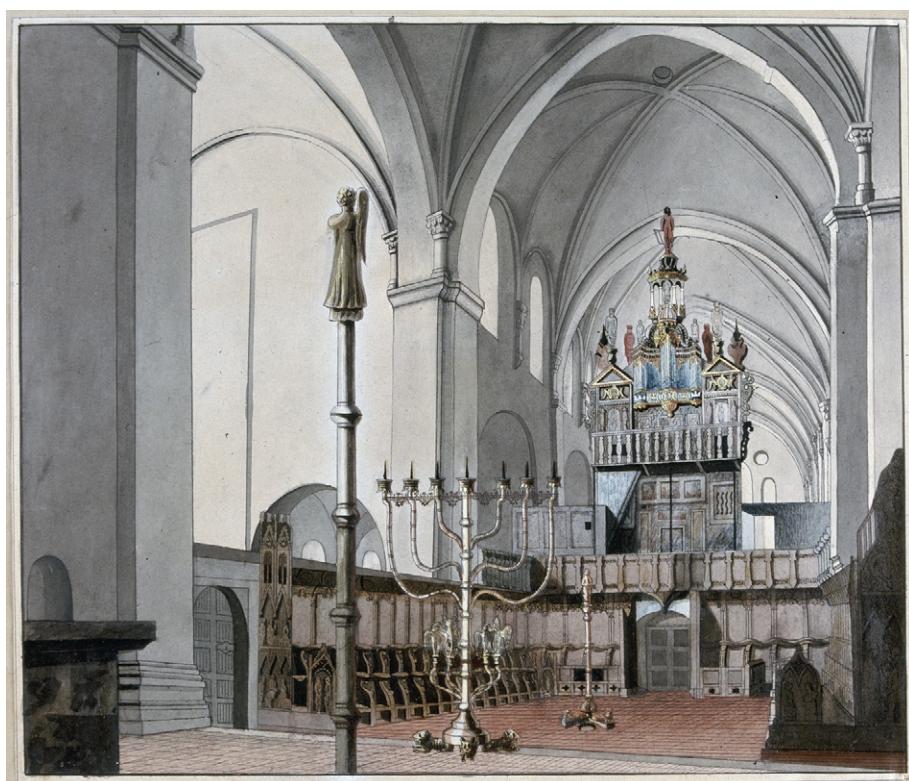
Bild 10. Lunds domkyrkas högkor från öster med korstolarnas ursprungliga placering före lektoriemurens nedrivande. Akvarell av F. Ahlgren 1833.

Denna typ av ljuskronor finns ännu bevarade i Hildesheim, Aachen och Groß-Comburg, och var uppbyggda i enlighet med beskrivningen av det himmelska Jerusalem i Johannes Uppenbarelsebok 21:9–27 med tolv änglar och tolv portar. Ännu högre upp, i absidens valv, som representerade himmelen, bör ha funnits kalkmålningar med en Majestasframställning och bilder av den yttersta domen. De bevarade bildsviterna i Vä, Finja, Vinslöv m.fl., men också Idensen utanför Paderborn, ger en fingervisning av vad som måste ha varit en enastående bildprakt.