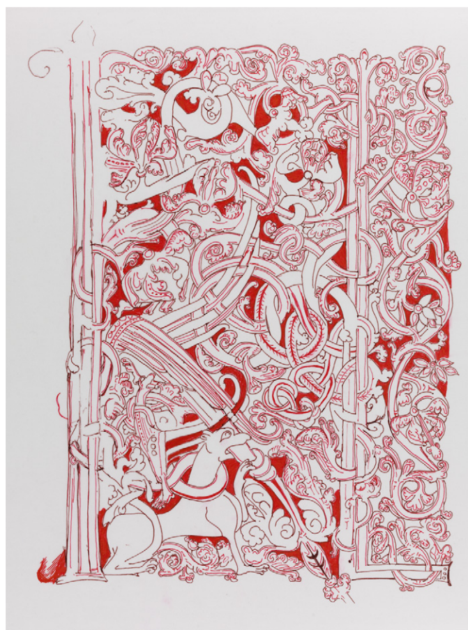
Bild 1 (t.v.). LUB Mh 7, fol. 8r: Renritning av första fasens konturteckning i brunt bläck.