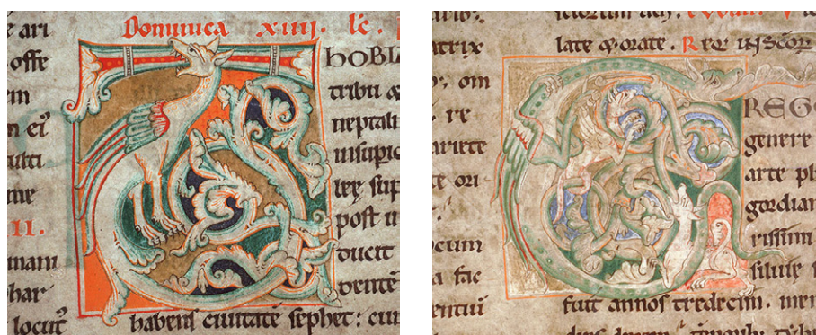
Bild 6 (t. h.). Amiens BM 143, fol. 155r: G-initial ur Corbielektionariet ca. 1140.