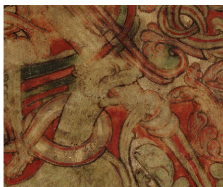
Bild 9. LUB Mh 7, fol. 8r: Detalj med lejonets huvud och drakens svans ur det stora KL-monogrammet.

Jag skulle vilja hävda att ett samband mellan LDV och Corbiektionariet inte kan ignoreras, och att textmässiga och skriftmässiga faktorer mycket väl kan ingå i detta sammanhang oavsett om skrivaren har varit fransk eller dansk. Det skulle vara rimligt att anta att en skrivare från Lund kopierade texten från en förlaga i Corbie, och att dekorationerna utfördes av en bokmålare på platsen. Den ovanligt ambitiösa storleken på KL-monogrammen motiverar en sådan arbetsfördelning, som bevisligen förekom i Corbie liksom i andra skriptorier under 1100-talet, men samtidigt kan det faktum att endast det första KL-monogrammet har färglagts tolkas som att ambitionsnivån har tonats ned under arbetets gång, på grund av tidsbrist. Övergången från dubbla konturer till enbart röda tyder på att man här inte längre har avsett att färglägga dem.