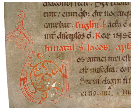
Bild 7 (t. v.). LUB Mh 7, fol. 114v. KL-monogram av enklare utförande.