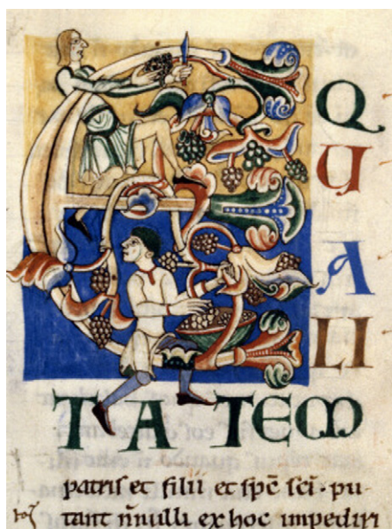
Bild 12. Dijon BM ms 141, fol. 75r. E-initial med vingårdarbetare. Ur Augustinus De Trinitate framställd i Cîteaux ca. 1100–30.

74 Eskils uppfattning om skärselden framträder tydligt hos Conrad av Eberbach.