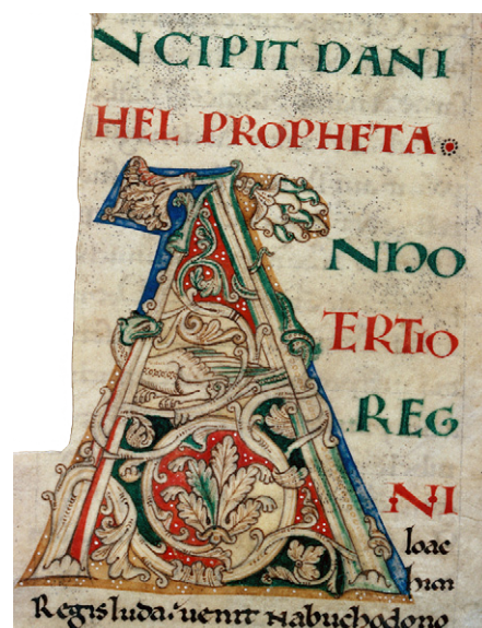
Bild 4. Reims BM ms 18, fol. 63r: A-initial ur Reimsbibeln ca. 1120–40.