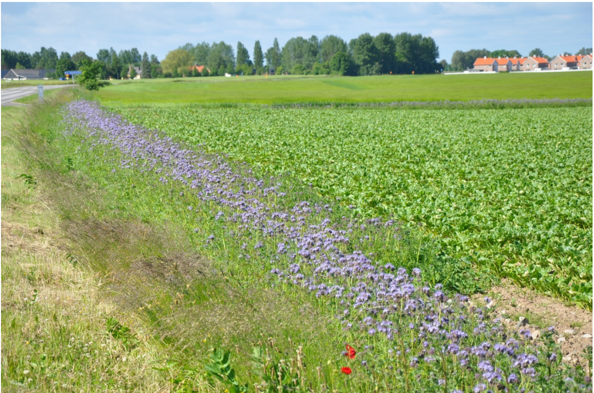
Figur 2. Exempel på olika sätt att implementera obrukade fältkanter (en av de godkända åtgärderna för ekologiska fokusarealer). Många obrukade fältkanter bestod 2015 av en cirka meterbred remsa bar jord som harvades regelbundet under vegetationsperioden för att förhindra etablering av ogräs (ovan). Den ekologiska nyttan av en sådan remsa är ytterst tveksam. Att istället så in blommande växter som honungsfacelia Phacelia tanacetifolia har däremot stort potential att gynna pollinerande insekter (nedan).