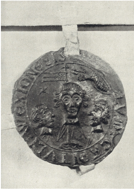
En av de få illustrationerna i Schmidts avhandling visar Växjö domkapitels sigill från 1292 med de tre martyrerna Unamans, Sunamans och Vinamans avhuggna huvuden.