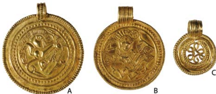
Fig. 2. Guldbrakteater (A–B) och hänge (C) som förvaras på Lunds Universitets Historiska Museum.

gång av korrespondens på Antikvarisk Topografiskt Arkiv i Stockholm påträffades ett meddelande från en Eurenus med uppgiften: ”Noréns brakteat är funnen i Slimminge sn Skåne vid harfning på en åker”. Detta meddelande dateras till 1869. Denne Eurenus är troligen samma person som skänkte en brakteat från fyndet i Kläggeröd till Malmö Museum 1881. Kläggeröd ligger just i Slimminge socken. Eurenus kände väl till fyndomständigheten.