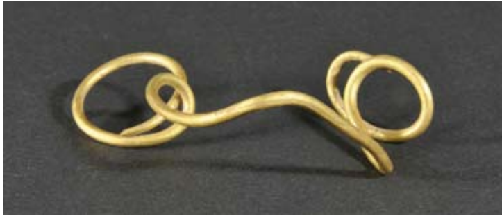
Fig. 5. Det senaste fyndet, en förvriden guldtråd.