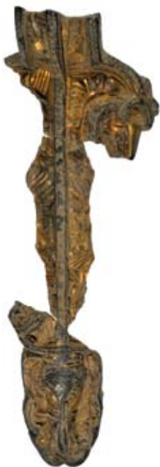
Fig. 3. Den centrala delen av ett reliefspänne i förgyllt silver med båge och fotparti.