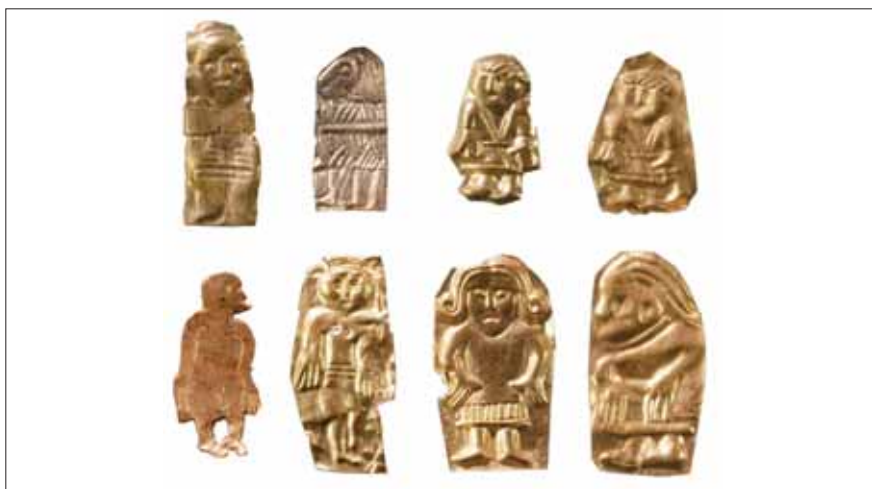
Fig. 2. Guldgubbar funna i trätemplet. Det rör sig om små människoframställningar stämplade i tunt guld eller klippta ur tunn guldplåt (längst till vänster i den nedre raden). Detaljer som frisyr och dräkt, men också händernas placering och fingrarnas ställning är noggrant markerade. Gubben längst upp till vänster har försetts med ett guldband, som föreställer en guldhalsring. Den största figuren är 1.7 cm lång.