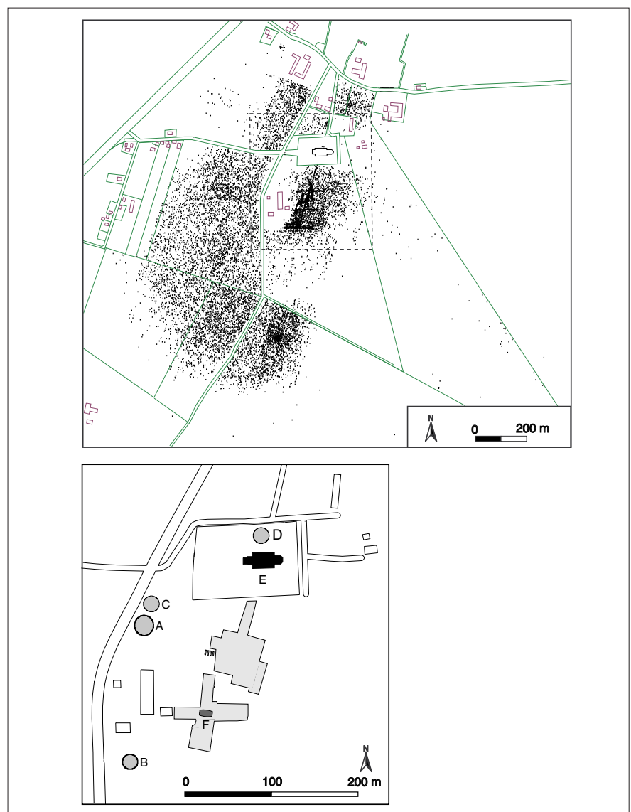
Fig. 1. Uppåkrayfyndplatsen med dess närområde. Övre planen: Punkterna markerar metalldetektorfynden, som ger en god bild av fyndplatsens omfattning. Det inramade området omfattar den nedre planen. Nedre planen: De gråfärgade ytorna markerar utgrävningssytorna. A: Storehög, B: Lillehög, C: raserad hög, D: raserad hög, E: Stora Uppåkra Kyrka och F: trätemplet.

sen. Sedan år 2000 har utgrävningar genomförts varje år. Det har visat sig, att bosättningen omfattar ett omkring 40 hektar stort område, som därmed är den största sammanhängande bebyggelsen i Sydskandinavien (fig. 1). Bosättningen dateras från omkring 100 före till ungefär 1000 efter vår tideräknings början.