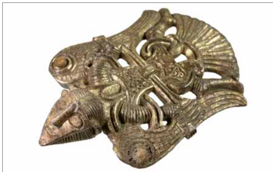
Fig. 9. Bronsbeslag, som troligen framställer Völund, då han flyr i sin fågeldräkt. Beslaget påträffades i en del av det yngsta huset från 700-800-talet. Det berättas, att smeden Völund fick hälsenerna avskurna av en kung och kvarhölls på en ö för att tillverka både grov- och finsmide. Efter att han dräpt kungens söner, flydde han från ön genom att tillverka en fågeldräkt.

Skelettdelar från minst fem människor, både yngre och äldre individer har påträffats inom huset. Liksom för den äldre brandtomten visar eldpåverkade ben, att de befunnit sig i huset, när det brann. Ett skulderblad visade, att personen fått ett spjut rakt genom kroppen (fig. 7). Till skillnad från den äldre brandtomten från 400-talet låg däremot ske-