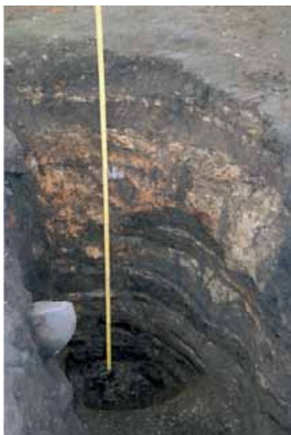
Fig. 8. Hål för ett av de stolppar som bar upp taket. Diameter på ungefär en meter, liksom djupet på en och en halv meter anger, att stolparna dels varit ytterst kraftiga, dels stabilt förankrade. I stolphålens sidor skimtar olikfärgade lager, som anger, att hålen grävts genom äldre golv- och raseringslager. De ljusare ytorna runt hålen är rester av golvlagret av lera, medan de rödaktiga fläckarna är rester efter brända lerväggar.

tagits omhand efter branden för att ges en anständig begravning. Att kropparna låg med armar och ben förhållandevis utsträckta, tyder på, att de redan var döda, då elden nådde dem.