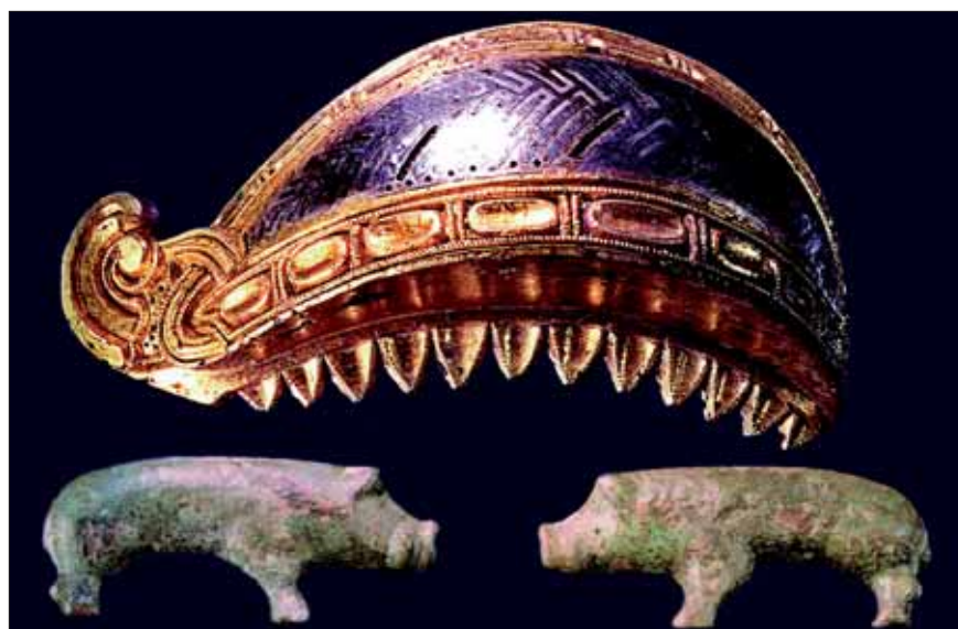
Fig. 3. Delar av en södersliten prakthjälms funna bland vapnen, som nedlagts söder om trätemplet. Ovan: En ögonbrynsbåge av förgylld brons med inläggning av silver. Nedan: Två svinformedade beslag. Beslagen har troligen suttit som prydnader på hjälmen.

Närmare 2 meter djupa hål har grävts för de takbärande stolparna, inte bara inne i huset utan också i dess fyra hörn. Detta kombinerat med fynd av en bägere i silver och brons med dekorerade band i guldbleck funnen invid en glasskål liksom ett hundratal s.k. guldgubbar bidrog till att ge byggnaden en särställning (fig. 2). Den uppfördes omkring 200 e.Kr. och byggdes om sex gånger med samma grundplan under en tid av minst sjuhundra år. En sådan sekvens tyder på en högst speciell byggnad – ett kulthus eller ett trätempel. Offer norr och söder om byggnaden av medvetet deformerade vapen, främst spjutspetsar i hundratal, förstärker dess