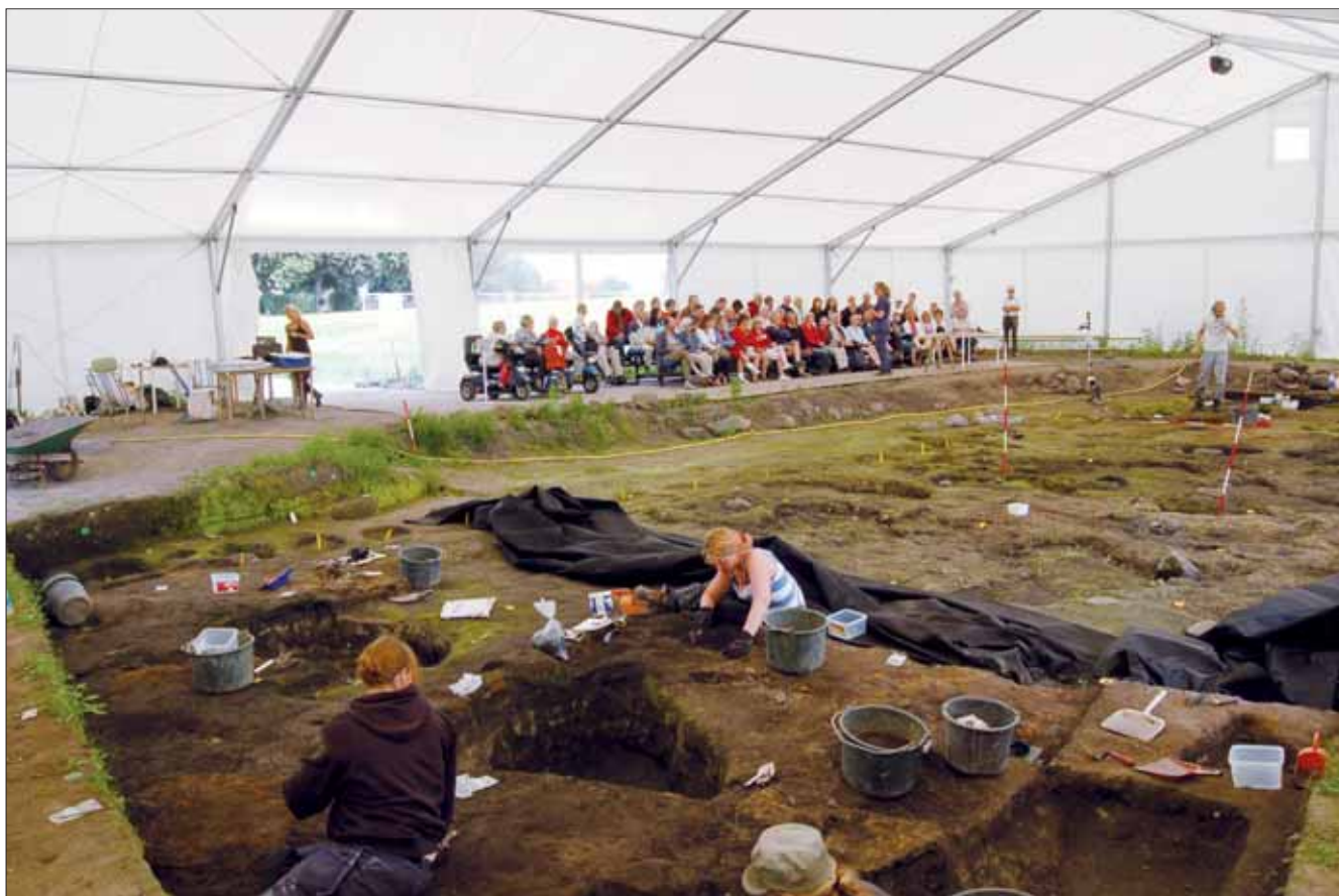
Fig. 6. Utgrävning av hallarna, som genomförts under ett stort tält. På detta sätt undveks både regn och starkt solsken. Ett podium utmed en långsida gav goda möjligheter för besökare att följa utgrävningen.

rituella karaktär. Även delar av en prakthjälm ingår bland fynden (fig. 3). Ett stort antal ben, där även delar av människor ingår, kombinerat med fynden av vapnen, gör platsen runt byggnaden än mer speciell.