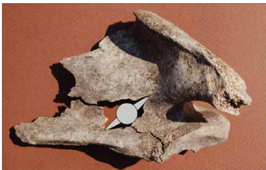
Fig. 7. Skulderblad från en ung människa med en kraftig skada. Personen har bakifrån genomborrats med ett spetsigt föremål. Tvärsnittet på en spjutspets har på försök projicerats in i hålet. Det passar väl med skadan, vilket tyder på, att ett spjut trängt rakt igenom kroppen.

tat samman (fig. 5). Under väggarna låg de sönderbrända kvarlevorna av tre vuxna personer invid varandra. Av resterna framgick, att betydande delar av kropparna låg kvar i det nedbrända huset. De hade inte