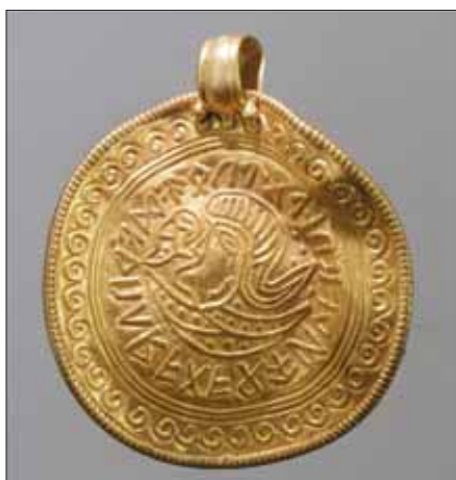
Fig. 4. Guldbrakteat. I mitten ett människohuvud och framför detta en fågel. Det är sannolikt en Odenframställning med en av hans informatörer, korporna Hugin och Munin. Runorna runt huvud och fågel är tyvärr inte möjliga att tyda, utan har fungerat som ett symboliskt skydd.

Lämningar efter stora hus påträffades, men den mest uppmärksammade byggnaden påträffad i Uppåkra är ett blott 13 meter långt hus med extremt kraftig konstruktion.