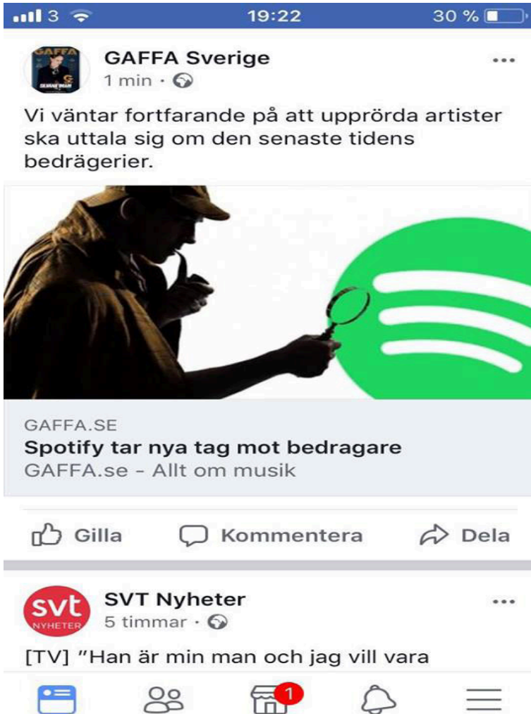
Fig. 2. Skärmdump, inlägg på tidningen Gaffa :s Facebooksida, som visar bild och länk till artikel om Spotify (10.3.2018).

på Baker Street 221 B, och grubblar på något av alla de fall som han har råkat dras in i. Att analysera exempel som dessa handlar om att dels identifiera och kategorisera de olika mediala egenskaperna, dels analysera hur mening produceras via de samverkande medierna.