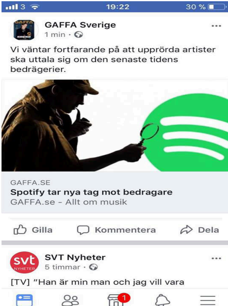
Fig. 2. Skärmdump, inlägg på tidningen Gaffa :s Facebooksida, som visar bild och länk till artikel om Spotify (10.3.2018).

på Baker Street 221 B, och grubblar på något av alla de fall som han har råkat dras in i. Att analysera exempel som dessa handlar om att dels identifiera och kategorisera de olika mediala egenskaperna, dels analysera hur mening produceras via de samverkande medierna.