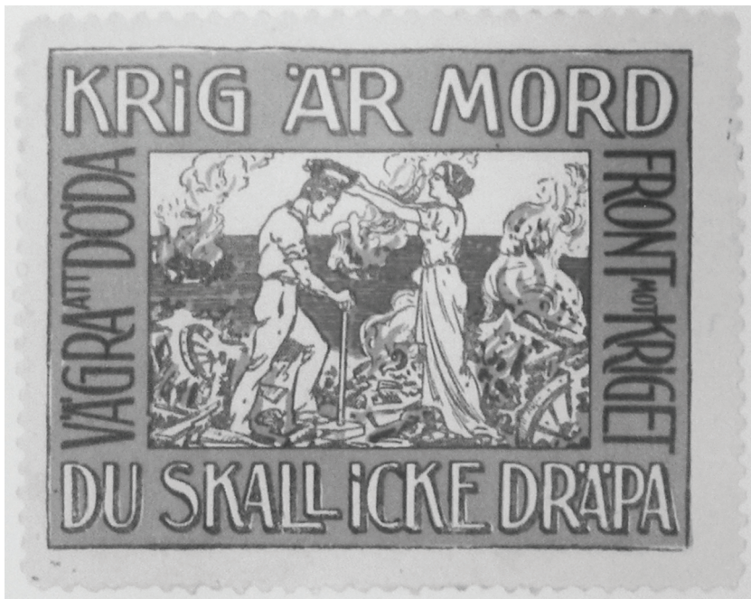
Bild 5. Antimilitaristiskt brevmarke utgivet av den ungsocialistiska militärkommittén 1914.

målmedvetne man, med den röda lagerkransen, socialismens och fredens segertecken”. 217 Även om den antimilitaristiska kampen måste föras med alla tillgängliga medel, var värnpliktsvägran tveklöst det mest beundransvärda.