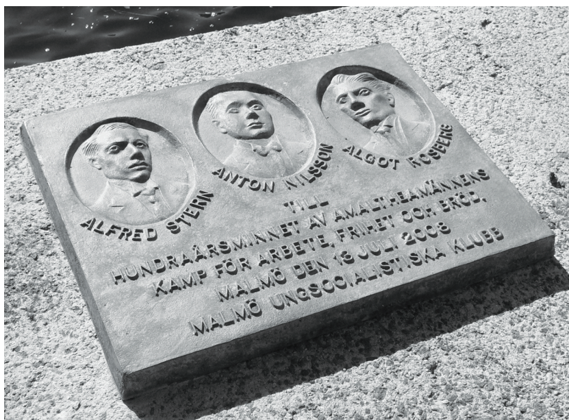
Bild C. Malmö Ungsocialistiska Klubbs plakett (som någon vecka efter fototillfället försvann) på Beijerskajen i Malmö till 100-årsminnet av "Amaltheamännens" aktion.

Det är med både glädje och stolhet som Centrum för Arbetarhistoria inom ramarna för sin skriftserie härmed publicerar Emma Hilborns undersökning av den ungsocialistiska identitetsformeringen i Skåne och Sverige. De förrådade kämparna blir därmed det andra numret av Skrifter från Centrum för Arbetarhistoria . Vår ambition med denna skriftserie är att ta ytterligare steg i arbetet med att profilera Centrum för Arbetarhistoria som ett lokalt, regionalt och nationellt centrum för kvalificerad, både bred och djup, arbetarhistorisk utbildning och forskning. Utöver detta ser vi även akademiens "tredje uppgift" som en hörnsten i vår verksamhet; vi strävar efter att kommunicera, sprida och förankra forskningsresultat och samhälls- och arbetarhistoriska perspektiv i vår omgivning. Genom skriftserien vill vi stimulera intresse och förståelse för samhällsförändring ur ett kritiskt och historiskt underifrånperspektiv.