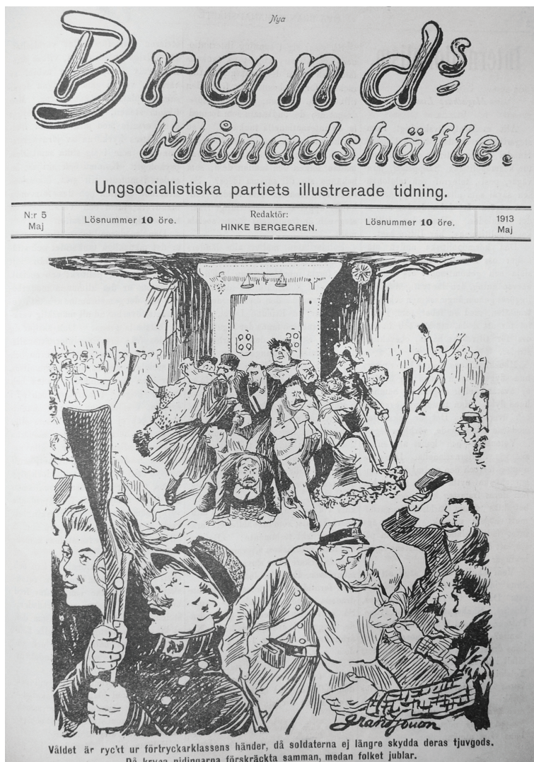
Bild 6. "Våldet är ryckt ur förtryckarklassens händer, då soldaterna ej längre skydda deras tjuv gods. Då krypa nidingarna förskräckta samman, medan folket jublar"... Brands Månadshäfte , Nr: 5 Maj 1913.

i Nya Folkviljan , insåg en skadad värnpliktig att militarismens odjur måste krossas. Med orden "Jag skall häda! Jag skall smäda!" förklarade han också att han inte längre var en parlamentarisk utan en revolutionär socialist. 303 Fräckheten och oräddheten blev ett uppseendeväckande bevis på olikheten mellan det revolutionära ungdomsförbundet och det reformistiska partiet.