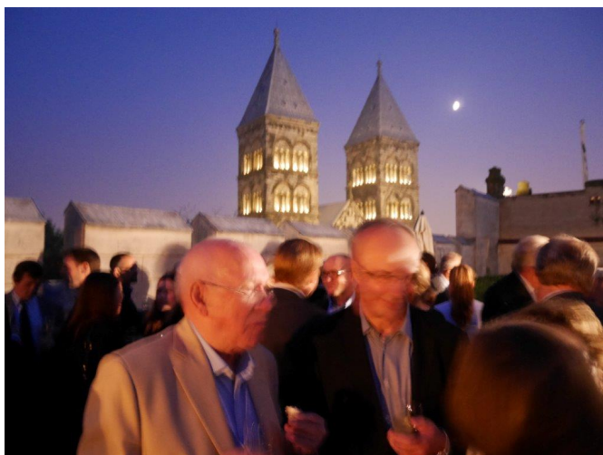
Mingel på Hypoteket med domkyrkan i bakgrunden