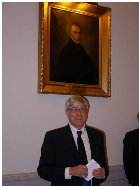
Eskil Wadensjö under porträtt av Carl Adolph Agardh