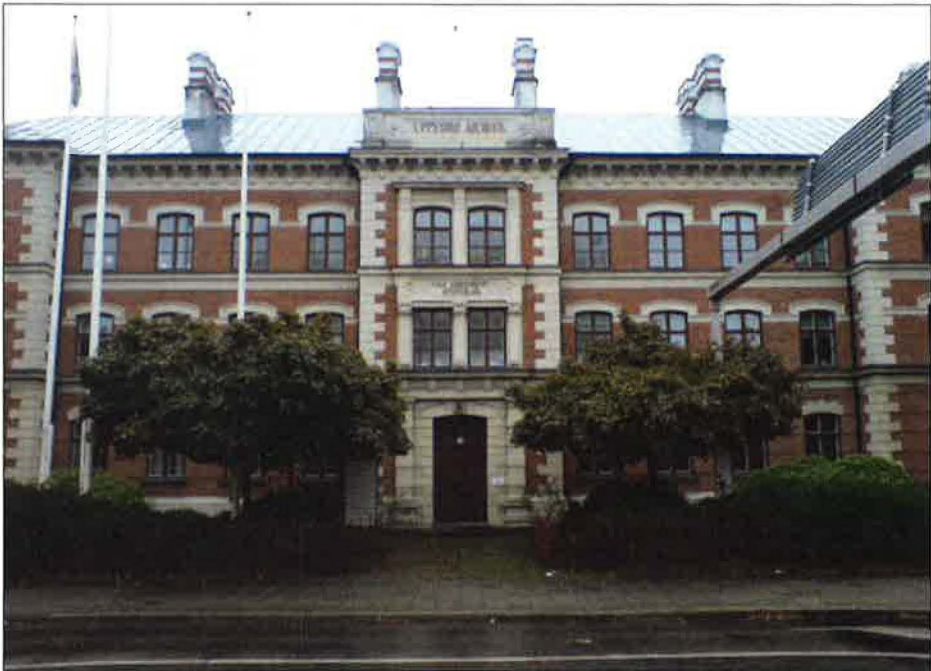
Nils Rosqvists stiftelse, Malmö.