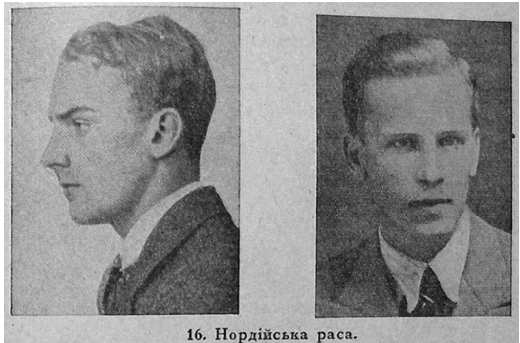
Рис. 1 . «Нордична раса» (Єндик, Вступ до расової будови України , с. 57)

Істотні різниці, що ми їх ствердили між москалями і українцями, є дуже важні для нас не тільки з погляду расознавства і расової гігієни, але і національного інстинкту, що в нашому народі не виродився, не зважаючи на більшовизм, і далі діє, як чинник відграничування, не розпускання і розпливання. (Єндик 1949, 378)