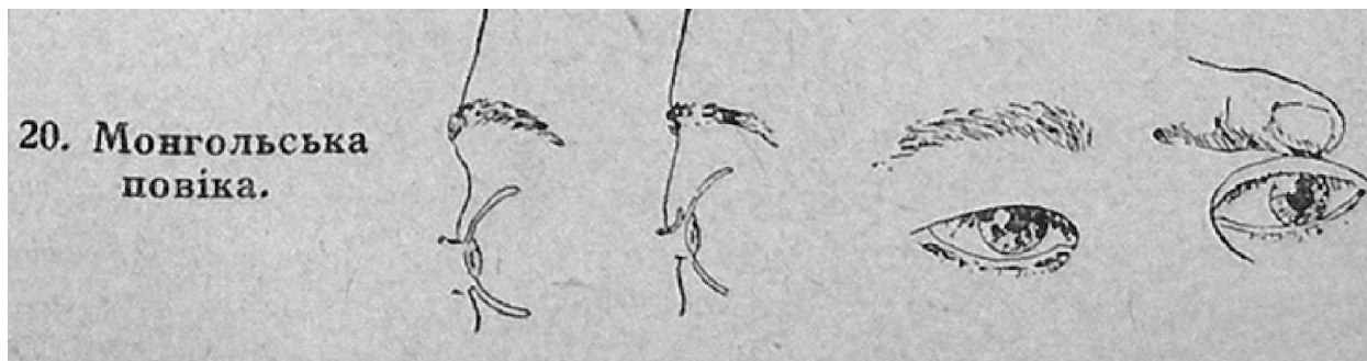
Рис. 3. Епікантний згин (Єндик, Вступ до расової будови України , с. 59)

(...) Стецько ще більше засмучувався з того, що його власні антисемітські публікації — навіть якщо більшість з них були опубліковані під псевдонімами — гальмували ефективність його антикомуністичної активності. У цьому він теж звинувачував євреїв. Донцову він скаржився, як «вони шлють мені мої антижидівські статті, бо я їх підписував, і отже увесь одіум світового жидівства піде на мене» (Ярослав Стецько до Дмитра Донцова, 22 листопада 1967, LAC, MG 31, D130, т. 5, папка 21). Гірко розчарований Сполученими Штатами і дедалі частіше зневірений у Баварії, якою керував Франц-Йозеф Штраус, Стецько вважав Франсиско Франко останньою надією Європи та християнської цивілізації 15 .