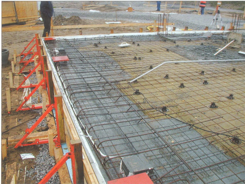
Gjutning av betongplatta till fältförsök av betongtorkning (N.Johansson)

tong och med olika ytbehandlings- och golvmaterial. Arbetet görs dels under kontrollerad miljö i laboratorium, dels under fältmässiga förhållanden på byggen. Avsikten är att öka kunskapen om hur man genom lämpliga val av betongkvalitet och produktionsteknik skall kunna minska de olägenheter som emissioner från golvsystem kan ge. Projektet finansieras av SBUF, Peab, Tarkett Sommer, Bostik, Mondo Nordic, Munters Torkteknik, Akzo Nobel, Freudenberg International och SFF.