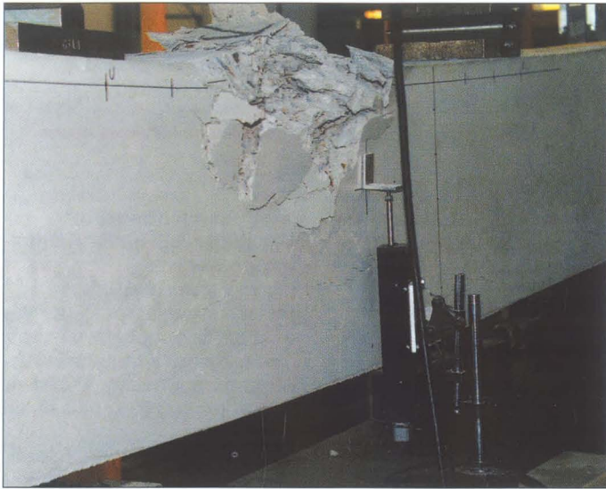
Böjprovning av en armerad balk med stora inre frostsador (M.Hassanzadeh)