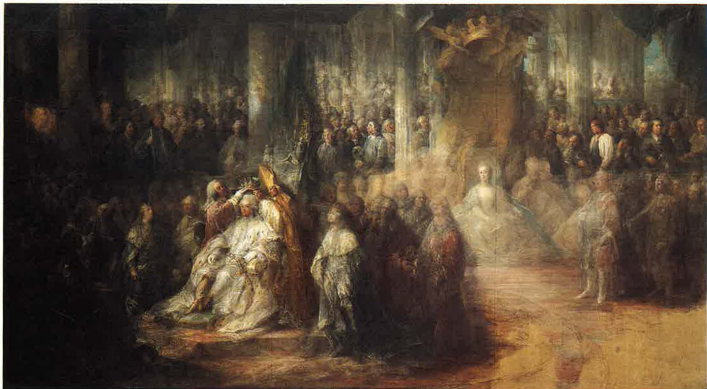
PILO, Carl Gustaf Gustaf III's kröning. 1782-93