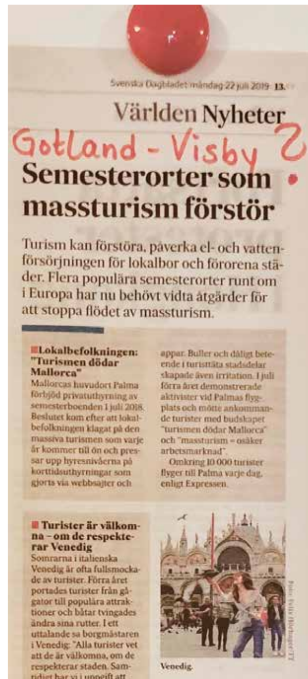
Bild 3. Tidningsurklipp med kommentar.

understryker att även om överturism är ett tämligen vagt fenomen som till stor del är ett resultat av protester mot olika urbana problem och nyhetsmedias rapportering, aktualiserar termen viktiga frågor om den urbana turismens utbredning, begränsningar och framtid. Diskussionen om överturism sammanfaller med den oreglerade delningsekonomin där bostadsdelningsplattformar drivit upp priser på bostäder och hyror i stadskärnorna. Lågprisflyg och synen på mobilitet och resande som konsumtionsvaror har medfört att fler reser oftare och under kortare tidsperioder. Överturism begreppet fångar på så vis en rad olika utvecklingslinjer och förändrade villkor för den urbana post-turismen men också för staden som sådan.