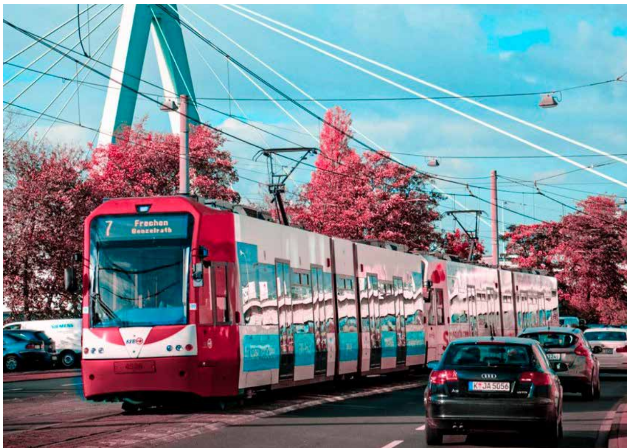
Bild 1. Överturismen belastar samhällets gemensamma resurser.

Den här rapporten har som huvudsakligt syfte att ge en kunskapsöversikt av den internationella forskningen om fenomenet överturism och hur spänningar inom den urbana turismen uppstår och hanteras i andra länder. Den är tänkt att fungera som underlag för svensk besöksnäringens arbete med att skapa hållbara destinationer. Vi koncentrerar oss i första hand på situationen i städer, men innehållet torde vara intressant även för destinationsutvecklare på mindre orter. Rapporten består av fyra delar i vilka vi diskuterar några olika definitioner av överturism och redogör för dess sammanhang och framväxt, drivkrafter och platsspecifika effekter. Avslutningsvis lyfter vi fram några lärdomar från den internationella forskningen kring överturism med relevans för svensk besöksnäring.