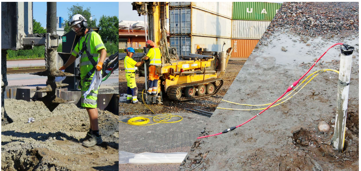
Figur 1. Första fälttester med ERT i Göteborg, sommaren 2018. Här användes ERT-kablar till för borrhålmätning i slitsade grundvattenrör.

De första testerna (Figur 1) utfördes vid Västlänken sommaren 2018 på KC-pelare innan, vid och efter stabilisering. Testerna visade på att det går att få elektrisk kontrast för behandlad och obehandlade massor även i marint avsatt lera men att det finns utmaningar i tolkning av data som behöver lösas (Olsson et al., 2019).