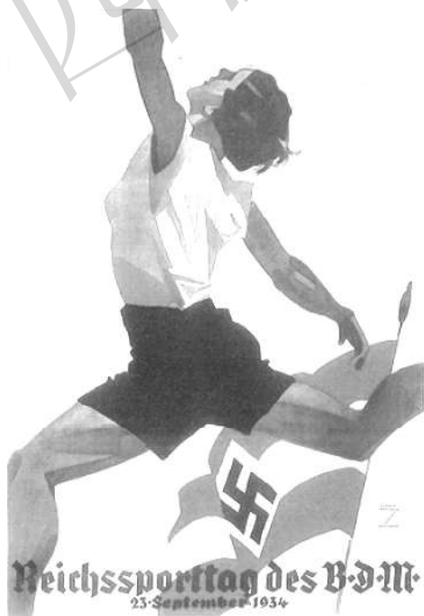
图 6 - b “德国女孩协会的帝国运动会” (海报, 1934)

另外, 犹太人经常被描绘成漫画的特征, 自德雷福斯事件以来, 这些特征就出现在反犹太人的漫画中。而且, 毫无人性的图画把犹太人描绘成有角、偶蹄和尾巴的邪恶生物, 或者像蛇、老鼠、害虫等 (见图 7 - a/b)。 ① 基本上, 无论口头上还是视觉上, 他们都被描述成寄生在地主国家, 毒害其文化, 夺取其经济, 奴役其辛勤劳作的居民, 并密谋占据 (经济) 世界的统治地位的外来种族。这种普遍的观点, 虽然对纳粹党来说既不新鲜也不独特, 但在中世纪时期已经被普遍认同, 现在变成一种国家支持的刻板印象。此外, 这里所描绘的国家社会主义肖像是——因为其中一项工作——旨在呈现和揭示雅利安人的家园与反对 (犹太人的) 外来世界的永恒冲突。有些图画作品无疑具有非常明确且经验丰富的叙事外表, 例如, 儿童读物或期刊文章中使用的插图, 附加的文字引出了更多习以为常的阅读内容。