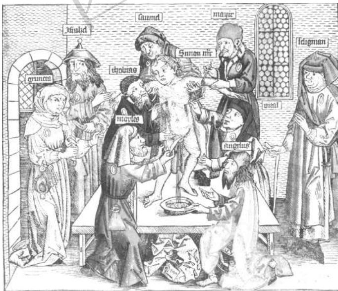
图 2 特伦特市西蒙谋杀案 (木刻, 1493)

四是投毒: 中世纪时期, 欧洲遭受了几波黑死病浪潮的严重侵袭, 黑死病是人类历史上最具毁灭性的流行病之一。由于当时不具备关于病毒或细菌的知识, 转而寻求其他的解释。其中最著名的解释是对犹太人在饮用水的源头下毒的指控。此外, 在欧洲瘟疫平息之后的几个世纪中, 类似关于“传播疾病的”犹太人的说法仍广为流传, 并一直延续到二十世纪五十年代的苏联或八十年代的阿拉伯世界。 ②