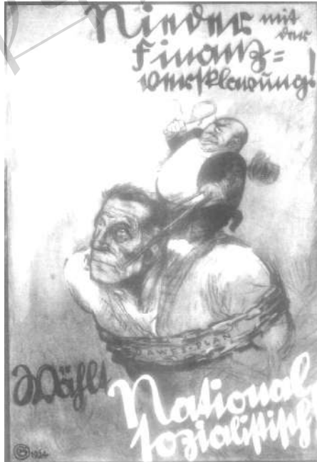
图 7-a “打败奴役！——投票给国家社会主义者！”（海报，1924）