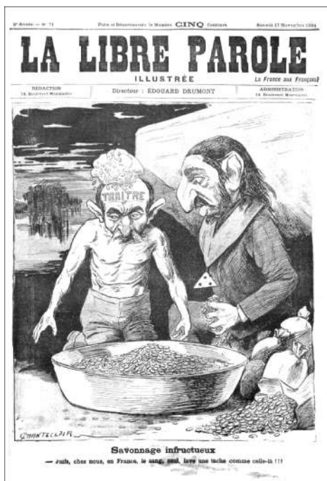
图 4 德雷福斯 (Dreyfus) 被另一个犹太人“洗了”

犹太符号性标志 (见图 4)。 ① 从那时起, 犹太人视觉上的他者轮廓被更加明确地勾勒出来, 同样在欧洲的其他地区, 例如, 德国、奥地利和斯堪的纳维亚半岛, 这一轮廓被运用于漫画式特征来进行描绘; 换言之, 选择特有而典型的特征, 尽管或即使是缺失细节, 使得犹太人他者轮廓具有可识别性、可记忆性和图示化 (参见第五节)。