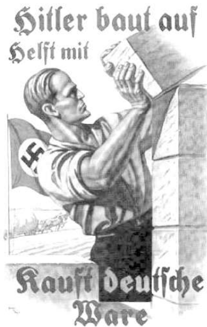
图 6 - a “希特勒在建设——帮助解决问题——购买德国商品”（海报，1924）

通常，像在其他图像媒介的艺术作品中，雅利安人被描绘成金发、蓝眼睛、长头型、光滑挺拔的鼻子，以及肌肉发达的高大身材——北欧种族惯有的外貌身型（见图 6 - a/b）。 ②