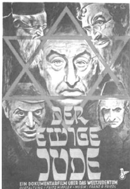
图 7-b “永恒的犹太人”（电影海报，Der ewige Jude；1940）