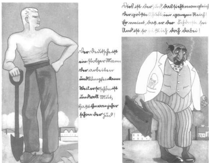
图 5 (德国人)自我与(犹太人)他者

在其他的媒体如期刊、海报和学校书籍中,为了强调对于当代政治和经济生活发展的焦虑感,在政治宣传的图画中,布尔什维克或犹太人他者的刻板印象就被明确地呈现了。这些显现的“典型的”外部特征,例如,他们所称的中东人和亚洲人,同样具有道德上、贬义上的特点。辛提人或罗姆人(吉卜赛人),特别是处于对立的、属于异教文化的特殊位置的犹太人,他们被剥夺了任何同化的选项,没有任何对话的可能,正如前面总结的那样。举个插图例子来补充纳粹党的整个叙述,在 1936 年出版的一本儿童绘本 Trau keinem Fuchs auf grüner Heid und keinem Jud bei seinem Eid (《不要相信绿色草地上的狐狸或犹太人的誓言》)(参见图 5)中,能够发现自我和他者之间的这种对立区别。 ①