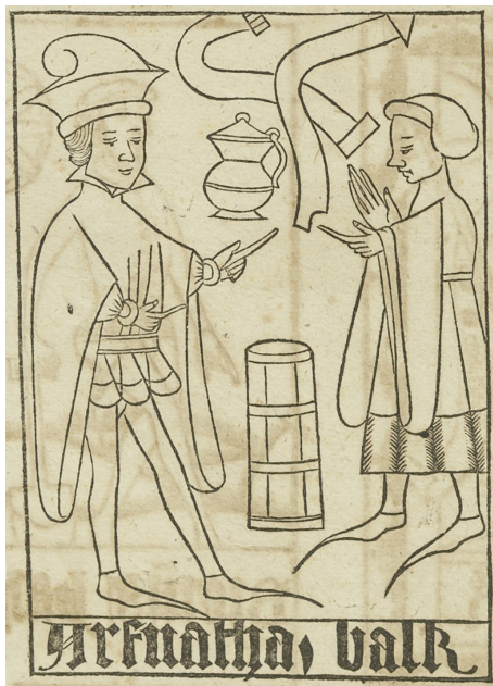
Figur 6. Ur Atlanticans planschband (tab. 26, NN).