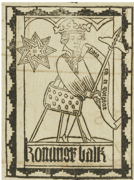
Figur 5. Ur Atlanticans planschband (tab. 25, fig. 92 B, KK). Den anslående kungabilden ur B 68 lånar sig åt många tolkningar. Rudbeck intresserade sig mest för dess talmystiska innehåll.

Bandknutar eller bandflåtor – geometriska figurer som slingrar in i varandra – förekommer i många olika utföranden i vikingatidens konst. Att de haft någon form av magisk eller symbolisk betydelse kan väl antas, men just vilken är inte alltid lätt att avgöra i det enskilda fallet. Med walknut avses numera vanligen tre trianglar som flåtats in i varandra. De förekommer både i varianter som löper ihop i en evighetssymbol och i varianter med tre självständi-