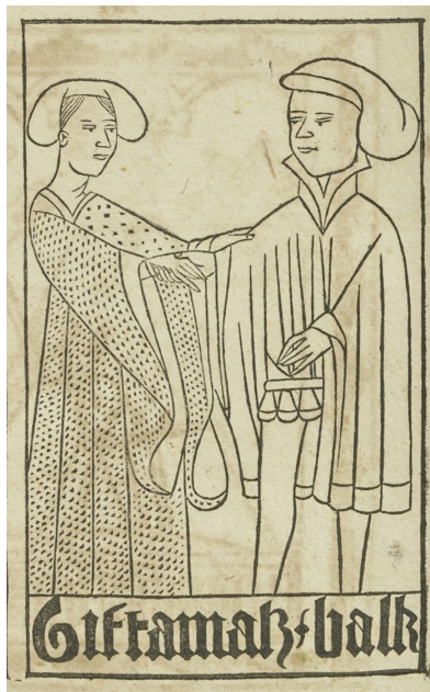
Figur 7. Ur Atlanticans planschband (tab. 26, MM).

berätta att ”Kallerna kalla Belgen de säckiar som hängia wid skiortan”, något som bekräftades av hans senantike kollega Nonius Marcellus. 17 Bälåg ”på vårt mål” betydde skinn eller säck, som i matbälåg eller matsäck, som ju göterna förde med sig på sina utfärder – bevis fanns i Hervararsagan och Ulfilas Bibel (”matibalåg”).