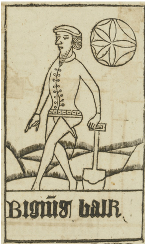
Figur 4. Ur Atlanticans planschband (tab. 25, fig. 92 B, LL). Bilden är tänkt att stödja Rudbecks argument att färgen blå har en särskild koppling till Sverige, men i originalillustrationen i B 68 är de byxor som skall underbygga bevisningen röda.

Citatet blev utgångspunkten för en vindlande tankekedja. Det som skulle bevisas var att den blå färgen alltid har kännetecknat Sverige. Rudbeck tog avstamp i altarskåpet i Gamla Uppsala kyrka, som enligt honom var ett av de äldsta i landet och bar bilder av två hedniska domare som dömer martyrerna. Den ene är klädd i "en mekta lång blå kiortel", den andre i "en lång blå kiortel, och framman til ett hwitt förkläde, som synes betyda rättens helighet och oskyldighet". Dessa figurer kopierades i planschdelen (fig. 1–2). Vidare noterade Rudbeck att på Sankt Eriks-tapeterna i Uppsala domkyrka avbildades kung Erik på sex eller sju ställen med blå underkjortel och en blå båtsmansmössa med lövverkskrans av guld. Även denna mössa fick en illustration (fig. 3). Samma