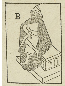
Figur 1–2. "Domarbilder" ur Atlanticans planschband (tab. 16, fig. 79 A och B). Figurerna är utförda efter Gamla Uppsalas kyrkas numera mycket hårt slitna altarskåp. Kungliga biblioteket.