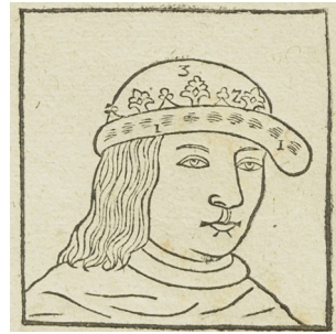
Figur 3. Ur Atlanticans planschband (tab. 41, fig. 156). Figuren är avbildad efter de så kallade Sankt Eriks-tapeterna, som förvarades i Uppsala domkyrka, men förstördes i den förödande stadsbranden 1702.