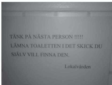
Toalettversion av den gyllene regeln.

I Goffmans bok The presentation of self in everyday life vidareutvecklas inte det rituella perspektivet, men han utgår från det som en förutsättning och uttrycker den rituella tematiken så här: ”respektfylld hänsyn för den helgade integritet som tillskrivs den agerande” (Goffman 1974 s. 66). Exempelvis är det jagets två ovan nämnda roller – rollen som heligt objekt respektive som aktör i ett rituellt spel – som är i arbete när Goffman menar att en individs framträdande innebär ”en expressiv förnyelse och bekräftelse av samhällets moraliska värden” (Goffman 1974 s. 39). Förutsättningen för detta är att själva framträdandet framhäver just dessa värden, vilket innebär att alla framträdanden inte gör det. Detta sagt mot bakgrund av att en del felaktigt tolkar Goffmans framställning som ett slags samhällelig marionetteater, där individens handlande nästan helt saknar frihetsgrader. Om vi hade varit marionetter hade det inte behövts skyltar som den nedan, där lokalvården skapar ett elfte budord – mycket likt den gyllene regeln – som aktualiserar den ömsesidiga ordning som handlar om respekt för nästan.