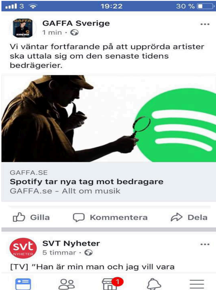
Fig. 2. Skärmdump, inlägg på tidningen Gaffa :s Facebooksida, som visar bild och länk till artikel om Spotify (10.3.2018).

på Baker Street 221 B, och grubblar på något av alla de fall som han har råkat dras in i. Att analysera exempel som dessa handlar om att dels identifiera och kategorisera de olika mediala egenskaperna, dels analysera hur mening produceras via de samverkande medierna.