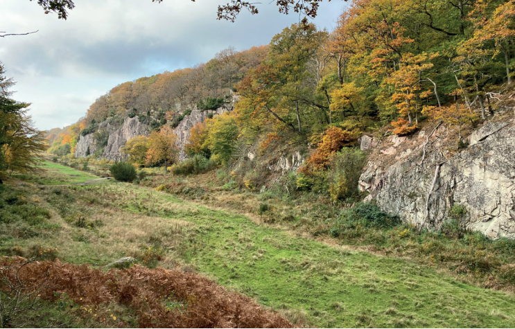
I den natursköna Ekkodalen på Bornholm kan man finna lavar som är knutna till gammelskog. Foto: Arne Thell den 25 oktober 2020.

Illustrationerna och teckningarna i boken är av utmärkt kvalitet, ofta med både en närbild av arten och en bild på växtplatsen med följerarter. Huvudsyftet med de välgjorda och detaljerade teckningar är att beskriva lavarnas biologi och anatomi i bokens inledande delar. De inledande kapitlen är främst tänkta att ge nybörjaren rätt information på ett pedagogiskt och lättförståeligt sätt. Den följande delen av boken är närmast en ekologisk översikt av olika, ofta väldigt vackra naturområden, där man finner merparten av öns lavflora, till exempel Hammershus fästning och andra ruiner, steniga platser, kustklippor, sandstränder och sprickdalar med gammelskogar. Därefter följer bokens huvuddel, en presentation av 116 personligt utvalda arter, ungefär en femtedel av det totala antalet lavararter som förekommer på Bornholm. Klokt nog avstår författaren från bestämningsnycklar till arterna. De skulle ändå bara ta glädjen från nybörjaren, väl medveten om att vissa arter inte är lätta att bestämma med endast foton och korta beskrivningar. Arterna är försedda med både danska och latinska namn med den nyaste accepterade taxonomin. Sist i boken finns en ordlista med lavterminologi, även den kompletterad med pedagogiska teckningar.