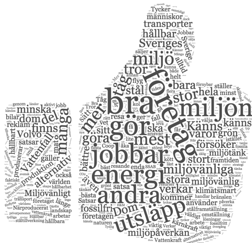
Figur 2. Ordmoln samtliga motiveringar varför man tyckte ett företag bidrog till att Sverige uppfyller agenda 2030.

Prisbelönta, Prissättning som gynnar många, Satsar på fossilfritt, Satsar på landsbygden, Satsning på second hand, Schysta arbetsvillkor, Smarta förpackningar, Små lokala är bättre, Stora och ställer krav på andra, Tillverkning I låglöneländer, Transparenta, Tydlig agenda, Tydliga med hållbarhetsinfo, Tydliga mål, Tänker inte bara på publicitet, Utsläppsfritt, Vegetariskt och veganskt, Återvinning, Öppna landskap.