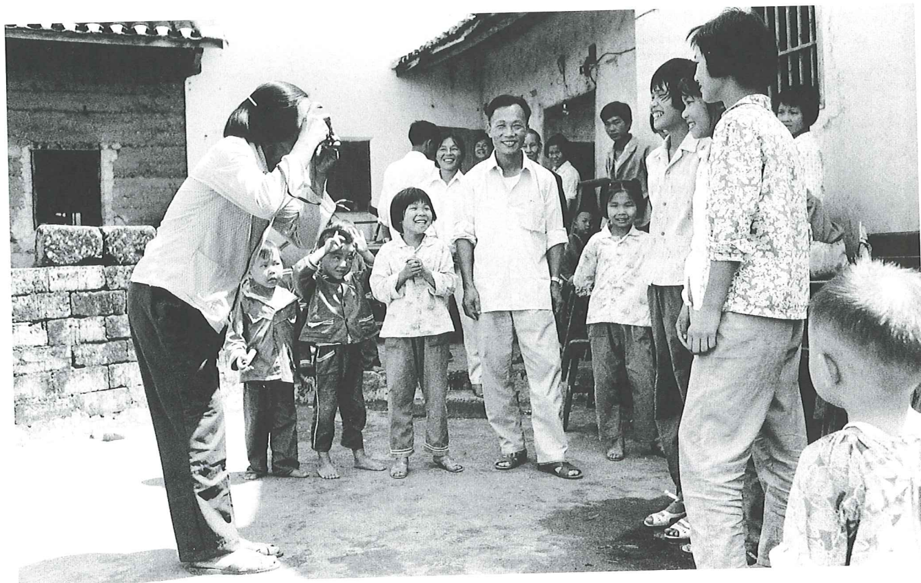
Många kunde i början av 80-talet skaffa sig en egen kamera, Guangzhou 1982.