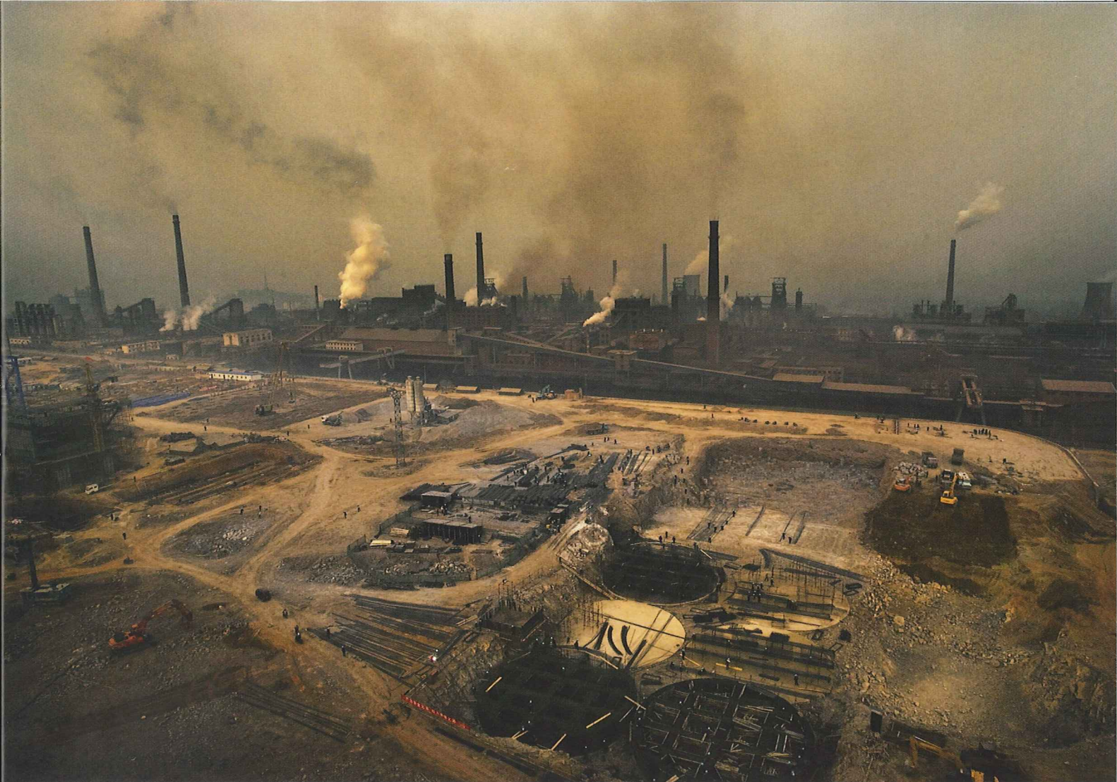
Stålverk i Hebeiprovinsen, 2008.

separatutställningar i Kina (bl.a. på utställningen i Shanghai 2014). Lu Guang har också samarbetat med miljöorganisationer som Greenpeace. Utställningen i Shanghai förra året visade på den stora tematiska och formmässiga bredden inom dagens kinesiska fotografi med exempel från landets mest etablerade fotografer och från en lovande yngre generation. Många fotografer fokuserade på den dramatiska förändringen av det kinesiska landskapet och urbaniseringen, medan andra mer utforskade sin egen identitet och personliga historia. En del av fotograferna använde sig av nya digitala teknologier, bl.a. experimenterade de med "selfies" och videoinstallationer, medan andra var mer förankrade i den analoga fotokonsten, och ytterligare andra inkorporerade element av traditionellt måleri i sina arbeten. Utställningen använde sig också av digitala hjälpmedel för att fördjupa besökarens upplevelse. Man kunde vid vissa fotografier scanna av en QR-kod via den sociala media-appen WeChat och lyssna på ytterligare information om fotografiet, och sedan skicka detta till vänner i ens sociala nätverk, som