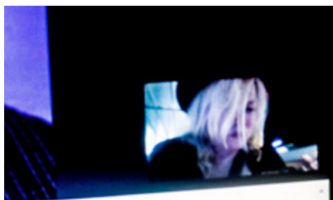
Behind the Screen.

Och så vaknar jag. Till en annan bild av verkligheten. Utanför hotellfönstret: staden och tv-tornet i Berlin, i en mjuk kvällsdimma. Solen har precis hunnit sänka sig bakom horisonten. Det har gått några dagar emellan. Vad hände? Egentligen? Ska jag gå till mina minnen så är det en tolkning av gårdagen. Eller om man så vill, vid det här laget digitaliserade minnesbilder i min lilla Leica.