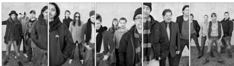
Fotograf Johan Bergmark MFAD SIDH mars 2013