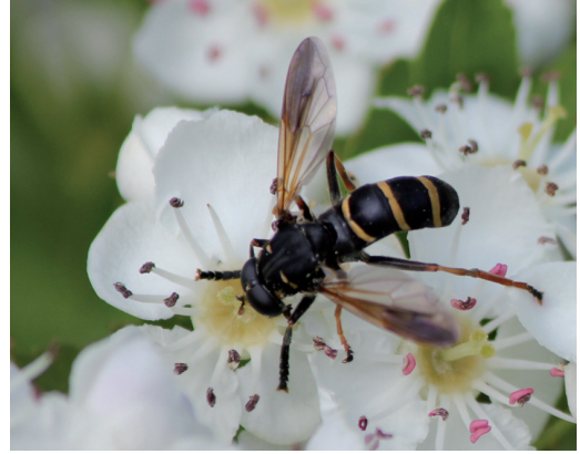
Figur 8. Hallonblomfluga Criorhina asilica och ängstigerfluga Temnostoma bombylans hittas ofta på blommande hagtorn.

Criorhina asilica and Temnostoma bombylans are often found on Crataegus in flower.