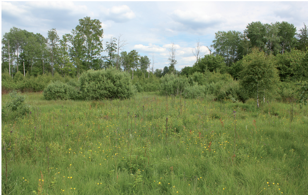
Figur 5. Sankångar i studieområdet är viktiga för många blomflugor, bl.a. de som lever i rötterna på kärtistlar, i grunda vatten och de som på våren besöker blommande videbuskar. Djäknaabygd 13 juni 2011.

Wet meadows are abundant in the study area and an important habitat for many hoverflies that depend on plants such as Circium palustre and Salix flowers as well as shallow water. The farm Djäknaabygd is especially species rich due to its rich variety in different habitats.