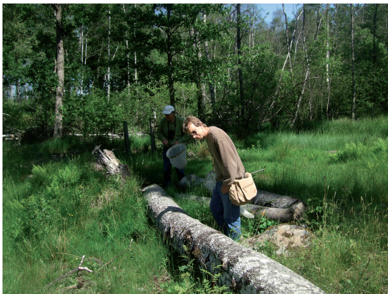
Figur 3. Vindfällda aspar som ligger åtminstone delvis i solen är habitat för de svenska ansvarsarterna rödbent mulmblomfluga Chalcosyrphus valgus , aspblomfluga Hammerschmidtia ferruginea och aspvedblomfluga Xylota meigeniana . Höö naturreservat 14 juni 2009.

Wildfallen aspen trees Populus tremula are habitats of Chalcosyrphus valgus , Hammerschmidtia ferruginea and Xylota meigeniana , which all are of European conservation concern.