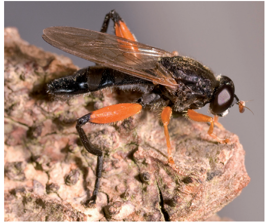
Figur 6. Aspsavblomfluga Brachyopa pilosa och rödbent mulmblomfluga Chalcosyrphus valgus har gynnats av att vindfällida aspar har fått ligga kvar i naturreservaten efter stormarna 2005 och 2007.

Brachyopa pilosa and Chalcosyrphus valgus has been favored by the storms in 2005 and 2007, when many windfallen aspen trees was left in the nature reserves.