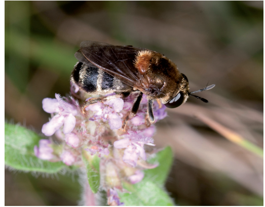
Figur 9. Slavmyreblomfluga Microdon mutabilis och rödmyreblomfluga Microdon myrmicae kan inte artbestämmas med säkerhet utifrån den fullbildade flygens utseende, men fyndplatsen på Råshult överensstämmer med rödmyreblomflugans habitat.

Paragus haemorrhous svarthårig stäppblomfluga. Djäknabygd ♂ 2006, ♂ 27 maj, ♀ 16 juni 2010, ♂ på smörblomma Ranunculus 21 maj, 2 ♂♂ 2 juni 2011; Diö ♂ och ♀ 21 juli 2010, ♀ 5 juli 2011; Duvelycke ♀ 7 aug. 2005; Möckelsnäs ♂ 15 juli 2008;