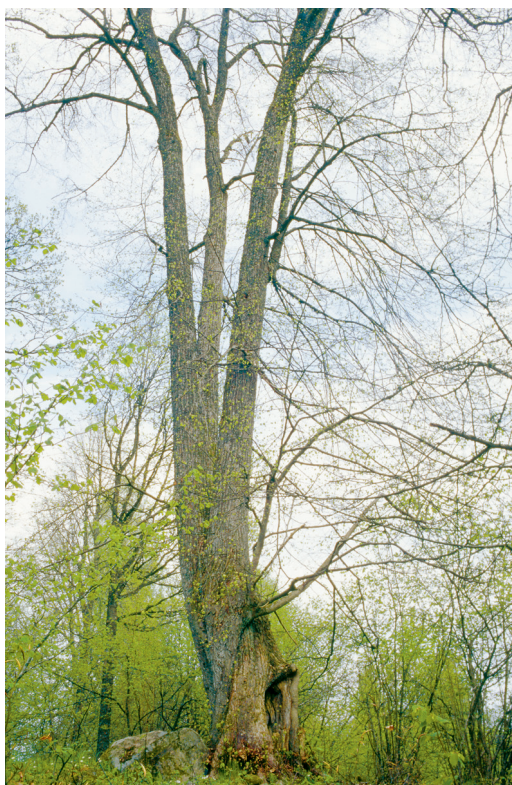
Figur 10. På bilden en gammal lind med ihålig stam som under flera decennier bebotts av fåglar i gamla spillkråkshål. Gamla ihåliga lövträd är habitat för flera arter i Stenbrohult som anses hotade på europeisk nivå, t.ex. mörk bronsblomfluga Callicera aurata , ljus bronsblomfluga Callicera aenea och jordhumleflugan Pocota personata . Djäknaabygd 2004.

Old hollow trees are especially abundant on some farms in the study area and are habitat of several rare hoverflies, e.g. Callicera aurata , Callicera aenea and Pocota personata . The picture shows an old hollow lime Tilia cordata .