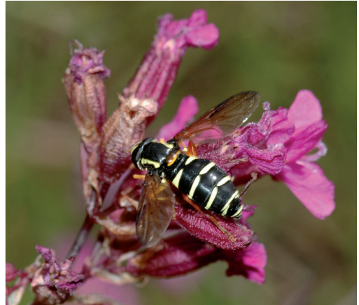
Figur 11. Smalkilblomfluga Xanthogramma citrofasciatum , en i Stenbrohult ovanlig art som bara hittats på två gårdar.

Temnostoma vespiforme getinglik tigerfluga. Djäknabygd ett ex. sågs på asplåga 9 juni, ♂ på chersminbuske 16 juni, på kirskaål Aegopodium ♂ och ♀ 2 juli samt ♂ 3 juli, ♂ över äng 14 juli 2009, ♂ på hagtorn Crataegus 16 juni, ♀ på grov asplåga 22 juni, ♂ 14 juli 2010, ♀ på hagtorn 31 maj, ♂ på kirskaål 30 juni, ♂ på vildros Rosa 2 juli 2011, ♂ på kirskaål 26 juni 2012; Bergön ♀ på älggräs Filipendula ulmaria 25 juli 2008; Höö ♂ på hagtorn 7 juni 2005, ♂ på hagtorn 11 juni 2006, ♂ på hagtorn 22 maj, ♂ och 3 ♀♀ (1 i parning) på kirskaål 24 juni 2007, ♂ på kirskaål 1 juli 2011; Stockanäs ♀ på