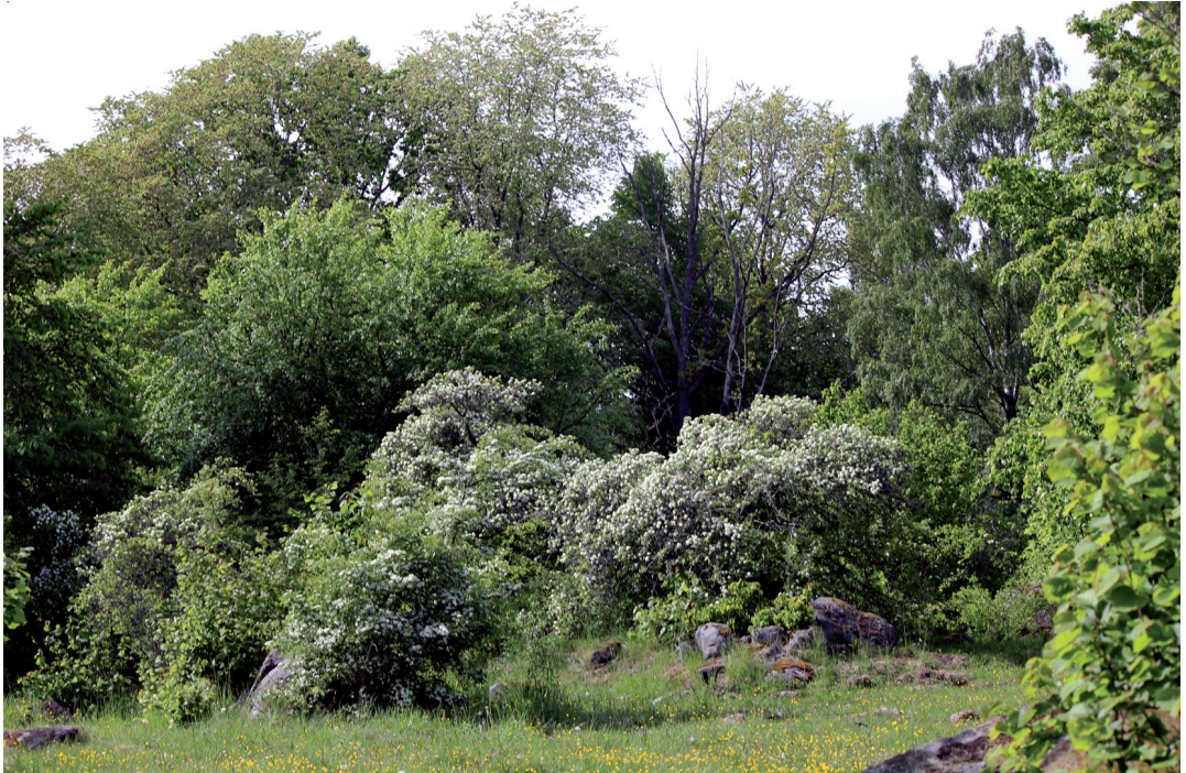
Figur 2. Hagtornsbuskar utgör viktiga nektarkällor för många blomflugor och är därför en bra plats och period att observera blomflugor på under blomningen. Taxås naturreservat 26 maj 2011.

Crataegus is an important plant, and many hoverflies are attracted when it is flowering in late May and Early June.