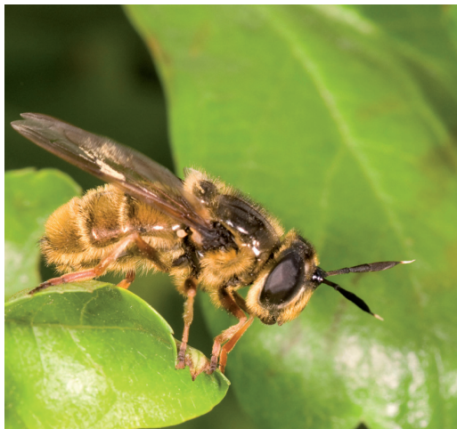
Figur 7. Ljus bronsblomfluga Callicera aenea på Höö 22 maj 2008.

Callicera aenea a rare species dependent on old trees. This female was found in the nature reserve Höö 22 Maj 2008.