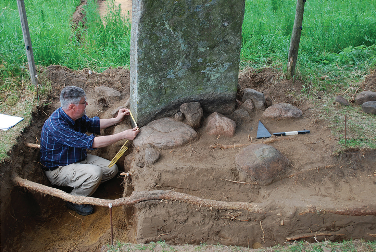
Fig.4. Per Stille dokumenterar runstenens textsida. Runt stenen syns den omgivande stenpackningen. Foto från söder, Martin Hansson.

till 40 centimeter breda. Trots det är det bara på den ena smalsidan som texten återfinns. Att på det här sättet ha texten enbart på ena smalsidan är något som gör stenen förhållandevis ovanlig. Texten finns på den smalsida som vänder sig åt väster. Denna sida är i princip helt är täckt av texten. Runinskriften består av två rader med runor som är cirka 11-15 centimeter stora. I slingans övre del är runorna något mindre, mellan 7-10 centimeter stora, kanske på grund av att ristaren fick ont om utrymme. Över runraderna finns ett inristat kors som är cirka 20x12 centimeter stort.