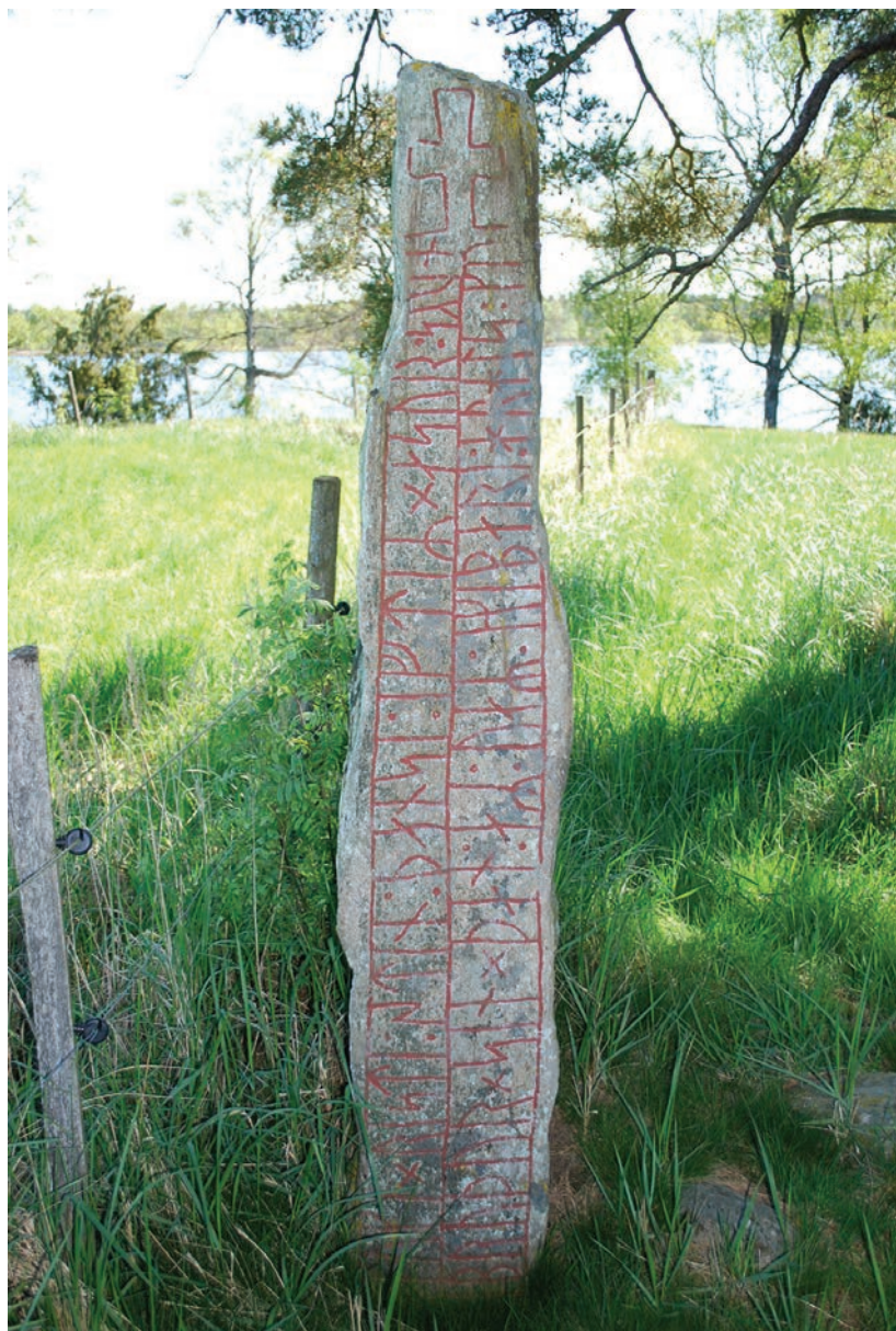
Fig 3. Runstenen Sm 42. I bakgrunden skymtar Ryssbysjön.

flertal enheter etablerats. Hypotetiskt sker denna kolonisation under tidig medeltid. Rent geografiskt ligger Tuna i det nordöstra hörnet av skogelaget, på den sandiga och lättodlade jorden invid Ryssbysjön, medan de sekundära enheterna etablerats i områdena söder och väster om Tuna.