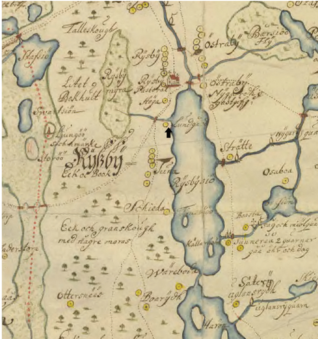
Fig 5. Utdrag ur häradskartan över Sunnerbo från 1685. Runstenens ungefärliga läge är markerat med en svart pil. Av kartan framgår hur huvudvägen från Ryssby viker av västerut efter passagen av den lilla ån strax nordväst om Lunnegård, medan lokalvägen söderut fortsätter genom Tunas bytomt. Lunnegård och runstenens avskilda läge vid strandkanten framgår tydligt.