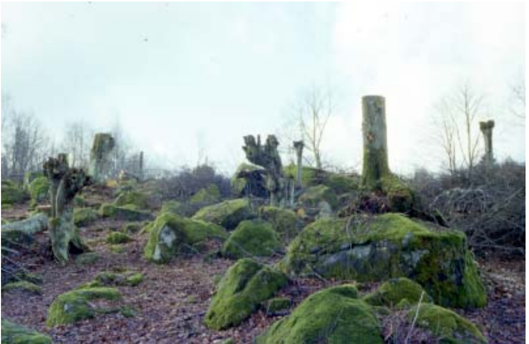
Figur 6. Gamla lindar vid Tångarne topphuggna 1995. Några av dem var ihåliga mulmträd som senast hamlades för ca 150 år sedan enligt årsringarna på sågytan. Ingreppet gjordes med naturvårdspengar!

Old lime trees, some hollow, cut in the name of nature conservation! This type of management is negative to the threatened species in the area.