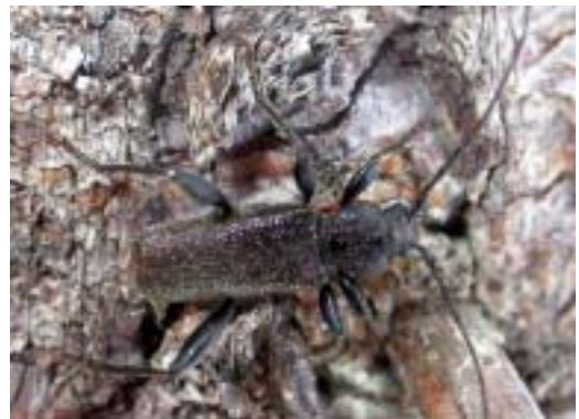
Figur 9. Bronshjon ( Callidium coriaceum ) lever på gran. På sikt klarar sig antagligen denna art bättre än de många rödlistade arterna i lövträdsved eftersom mängden gran ökat.

VU Cryptophagus fuscicornis Taxås V gården ett ex. i mulm i grov ihålig lind med starbo i hagmark 24 aug. 1987. Djäknabygds bokbacke enstaka ex. i mulm från ihålig bok med fågelbon 25 aug. 1987, grov bokhögstubbe 22 aug. 1994 samt 3 ex. i mulm