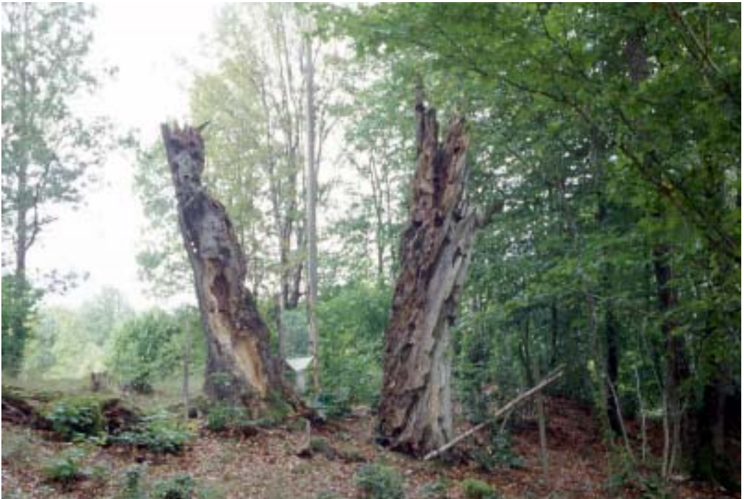
Figur 3. Grova bokhögstubbar vid Djäkabygd i oktober 2001 undersökta med en fönsterfälla 1991-2002. Avlång flatbagge Grynocharis oblonga har nästan årligen setts krypa på dessa stubbar och Cryptophagus fuscicornis sållades från den ihåliga toppen av det vänstra trädet som bröts i juni 1998 och därefter dog.

Big dead beeches with a window-trap in 1991-2002. Grynocharis oblonga and Cryptophagus fuscicornis have been found in these stems, the latter species in a hollow before the tree died.