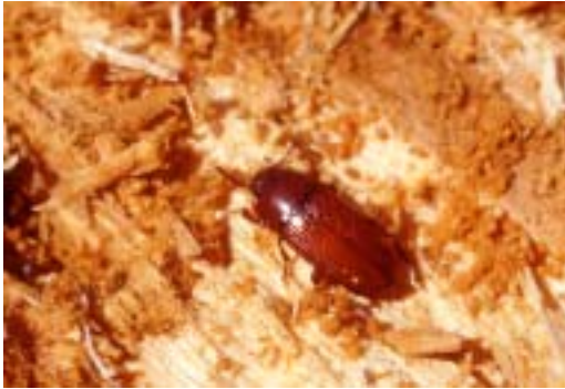
Figur 8. Större sågsvartbagge ( Uloma culinaris ) är en rödlistad art som hittats i grova döda stammar av lövträd.

Uloma culinaris is a red-listed species that live in coarse dead deciduous trunks.