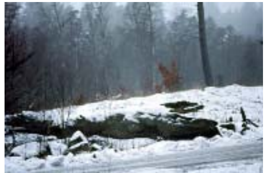
Figur 5. Utdöendeskulden är särskilt stor i Stenbrohult för arter beroende av solbelysta jätteekar. På bilden en jätteek på Råshults Södergård 1967, nyligen nedblåst efter att tät, äldre granskog som tagit död på eken avverkat ett par år tidigare. I början av 1900-talet stod eken öppet i en betesmark tillsammans med andra gamla ihåliga ekar som rönt samma öde.

För arter som lever i ihåliga lövträd kan beroendet av grova träd orsakas av att träden blir ihåliga först när de blivit riktigt gamla, ofta över 150 år. Ett grovt hålträd kan troligen också behålla fukten bättre än klenare träd vid extrema torrperioder. Vissa av arterna som lever i mulmträd hittas bara i anslutning till något fuktigt mulm, t.ex. trubbtandad lövknäppare Athous