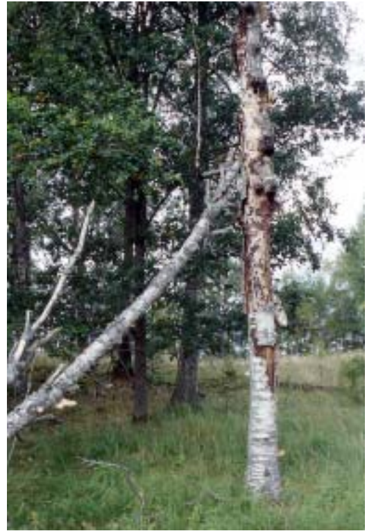
Figur 7. Grov björkhögstubbe i hagmark vid Stenbrohult kyrka 2001 med sprängticka, fnösketicka, klubb-ticka och björkticka, ett substrat som hyser många rödlistade skalbaggsarter i trakten.

I nedanstående fyndlista återkommer vissa platser flera gånger. Djäkbynabygds bokbacke avser ett mindre bestånd med en äldsta generation med 200-280 år gamla bokar, ca 400 m S gården Djäkbynabygd, som ligger ca en km SÖ kyrkan. Här har fönsterfällor varit uppsatta vid två grova bokhögstubbar (Fig. 3). En jätteek 700 m SSV kyrkan på Stenbrohults Prästgård benämns nedan bara som jätteek (BH-omkrets 448 cm). Den stod tills för ca 25 år sedan skuggigt i gammal granskog, men står nu solbelyst, har stora ytor med exponerad ved och sannolikt flera kubikmeter mulm. Eken, som bl.a. hyser hästmyror och oxtungsvamp, har åldersbestämts till minst 400 år (M. Niklasson muntl.; bild i Nilsson & Rundlöf 1996). En ca 300 år gammal och ihålig ek på Höös högsta punkt, ca 200 m N gården, blåste av i en storm 1990. I den 2 m höga kvarvarande högstubben har flera fynd gjorts och den benämns nedan jätteek på Höö (omkrets 680