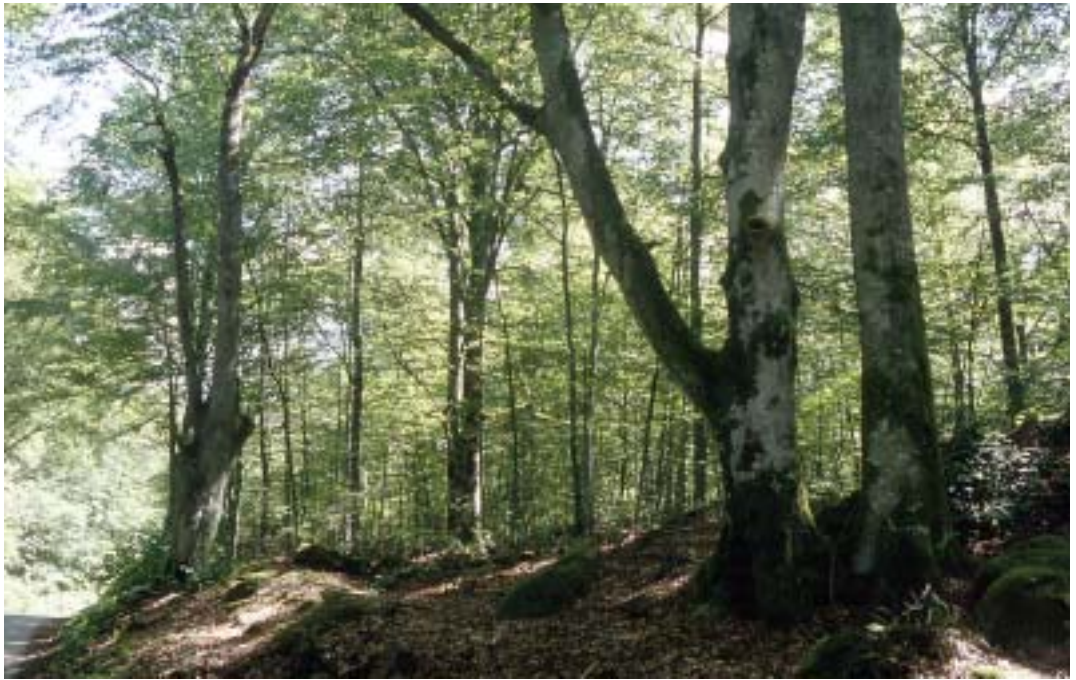
Figur 4. Bokdominerad skog med tidigare hamlade (topphuggna) lindar på gården Taxås 1993. Många äldre ekar och bokar gallrades bort i denna skog 1977/78. Området utgör en del av det som förr var en stor frälsefastighet där även gården Möckelsnäs ingick.

Old beech-dominated forest with some oak and lime trees.