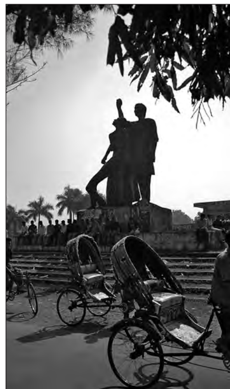
Bangladeshiskt frihetsmonument i Savar, norr om Dhaka.

Med det spända läget var det förstås färre turister än vanligt, och på Kathmandu Guest House i Thamel rådde det en viss stilltje när strömmen av ryggsäcksresenärer sinat betydligt. Ändå såg det mesta ut som vanligt och vi besökte och blev förevisade de välbevarade palatsen och templen i