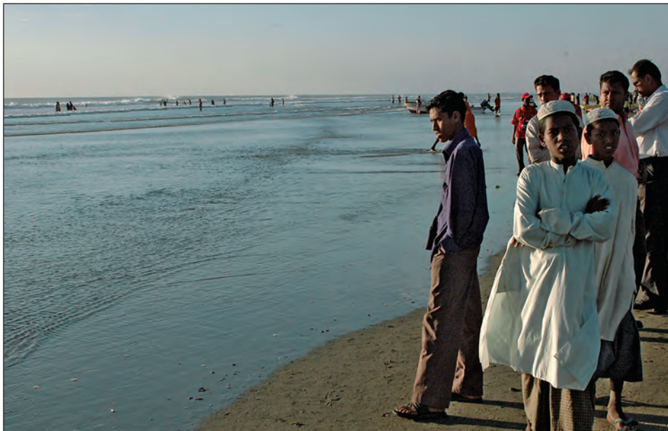
Strandliv på beachen i Cox's Bazar, Bangladeshs semesterparadis nära gränsen till Burma.