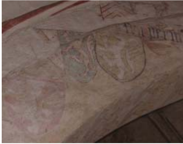
Bild 2. Överst till höger syns inskriften "fru pernilla", antagligen syftande på Niels Svendsens bustru Pernille Pedersdatter (Thott). Kring hennes sköld är ett par sköldar målade vars ägare är oklara.

Bilden på den norra korväggen innehåller en vapensköld, placerad omedelbart under de avbildade personerna. Dessvärre syns numera endast sköldens konturer och en hjälm med hjälmprydnad. Prydnaden innehöll ursprungligen buffelhorn med vippor eller