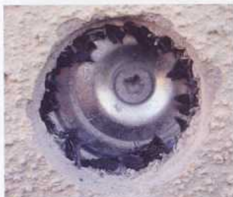
Bild 4: Utborrning av putsen vid en "vit prick". En metall kramla syns bakom putsen.

Mögelsvampar är beroende av en organisk kolkälla och måste därför hitta organiskt material från underlaget för att kunna växa.