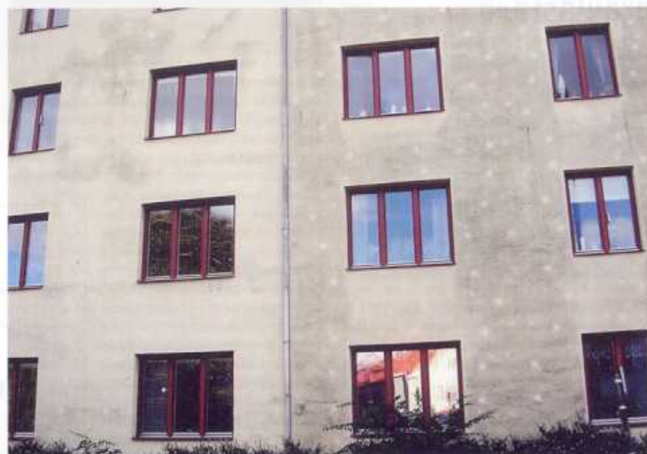
Bild 2: Fasad på byggnad i Kristianstad. Högra hälften har kraftig påväxt och vita prickar syns. Vänstra hälften har nästan ingen påväxt.

De första delresultaten från mätningar under våren visar att temperaturvariationerna i tunnputs på isolering är betydligt större än i en tegelfasad. De största dygnsvariationerna fanns i tunnputsfasaden i söderläge med röd kulör. Ytemperaturen på fasaden varierade mellan -2^{\circ}\text{C} och +53^{\circ}\text{C} . Tunnputsfasaden uppvisade också den största temperaturskillnaden mellan ytan och luften. På den vita lättfasaden i söderläge var temperaturen lika låg på natten, men uppnådde bara +28^{\circ}\text{C} på dagen. Som jämförelse blev temperaturen på tegelfasaden i söderläge maximalt +37^{\circ}\text{C} på den röda halvan och +22^{\circ}\text{C} på den vita halvan. När ytemperaturen är lägre än lufttemperaturen, vilket främst inträffar under nattetid, blir den relativa fuktigheten i fasadytan hög. Detta kan medföra kondens på fasadytan och risken för biologisk påväxt är då mycket stor. Vid senare tillfällen, under hösten, har