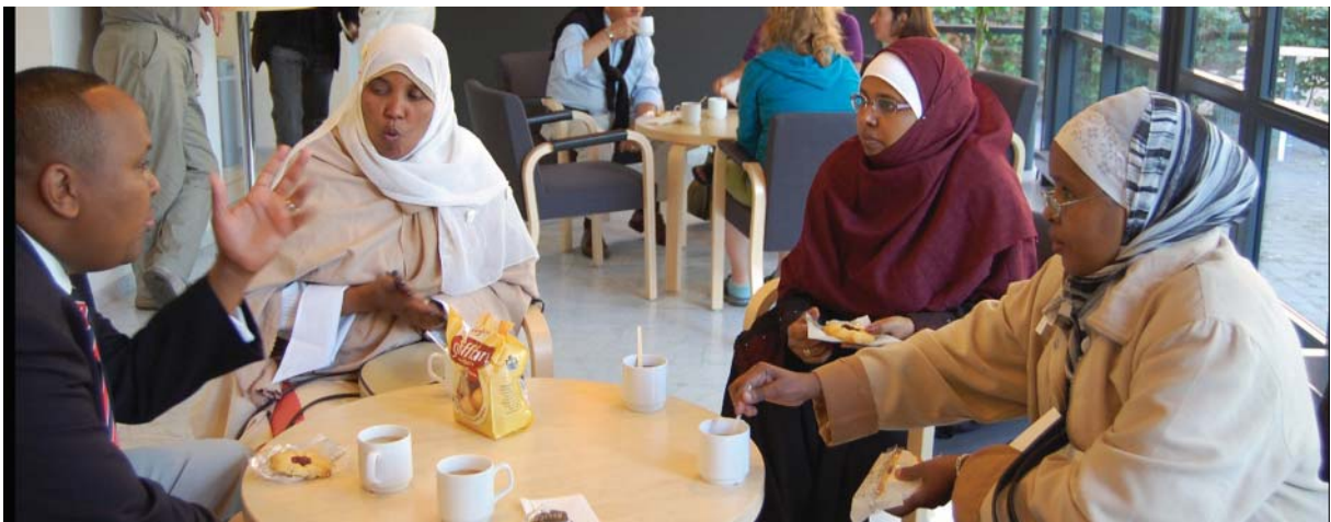
Malmö stadshus: Kaffepaus med diskussion.

Om vi bryter ner dessa siffror på de tre storstäderna framträder följande bild: Sysselsättningen är högst bland somalier i Stockholm men har fallit från 33,3 procent 2000 till 31,9 procent 2005. Bland män har sysselsättningen fallit från 44,6 till 35,8 procent medan den bland kvinnor ökat från 20,8 till 27,6 procent. I Göteborg har sysselsättningen under femårsperioden ökat från 16,7 till 22,4 procent. Bland män har den ökat från 21,5 till 27,0 och bland kvinnor från 11,6 till 17,8 procent. I Malmö slutligen har sysselsättningen ökat något lite från 16,9 till 18,9 procent. Bland män har den ökat från 16,5 till 22,2 procent medan den bland kvinnor minskat från 17,3 till 15,7 procent. Ljuspunkterna är alltså ökad sysselsättning bland kvinnor i Stockholm, bland män i Malmö och totalt i Göteborg. Antalet individer och andelen sysselsatta av dessa i riket och storstäderna framgår av nedanstående tabell.