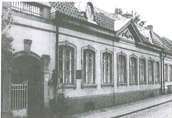
Axel Wallengrens barndomshem från 1876 på Tomegapsgatan 24 (idag)