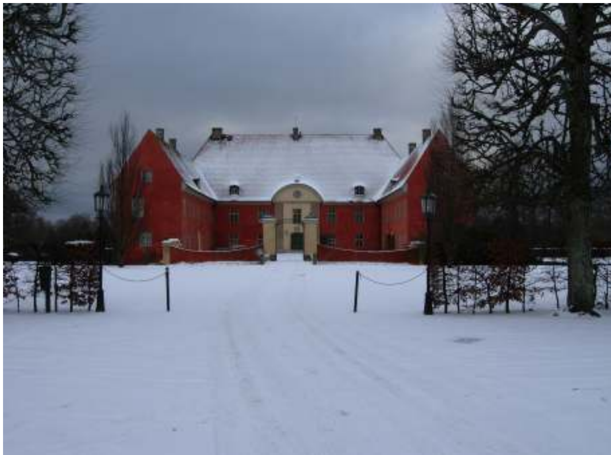
Figur 2. Bror Emil Hildebrand anlände till Krapperup en januaridag 1828. Då hade borgens fasader en annan kulör, men i övrigt var nog stämningen ungefär densamma som en vinterdag på 2000-talet; tyst, lite ödsligt och stilla.

och olika lagerbyggnader, och anläggningar som fördämningar, dammar och kanaler, se figur 3.