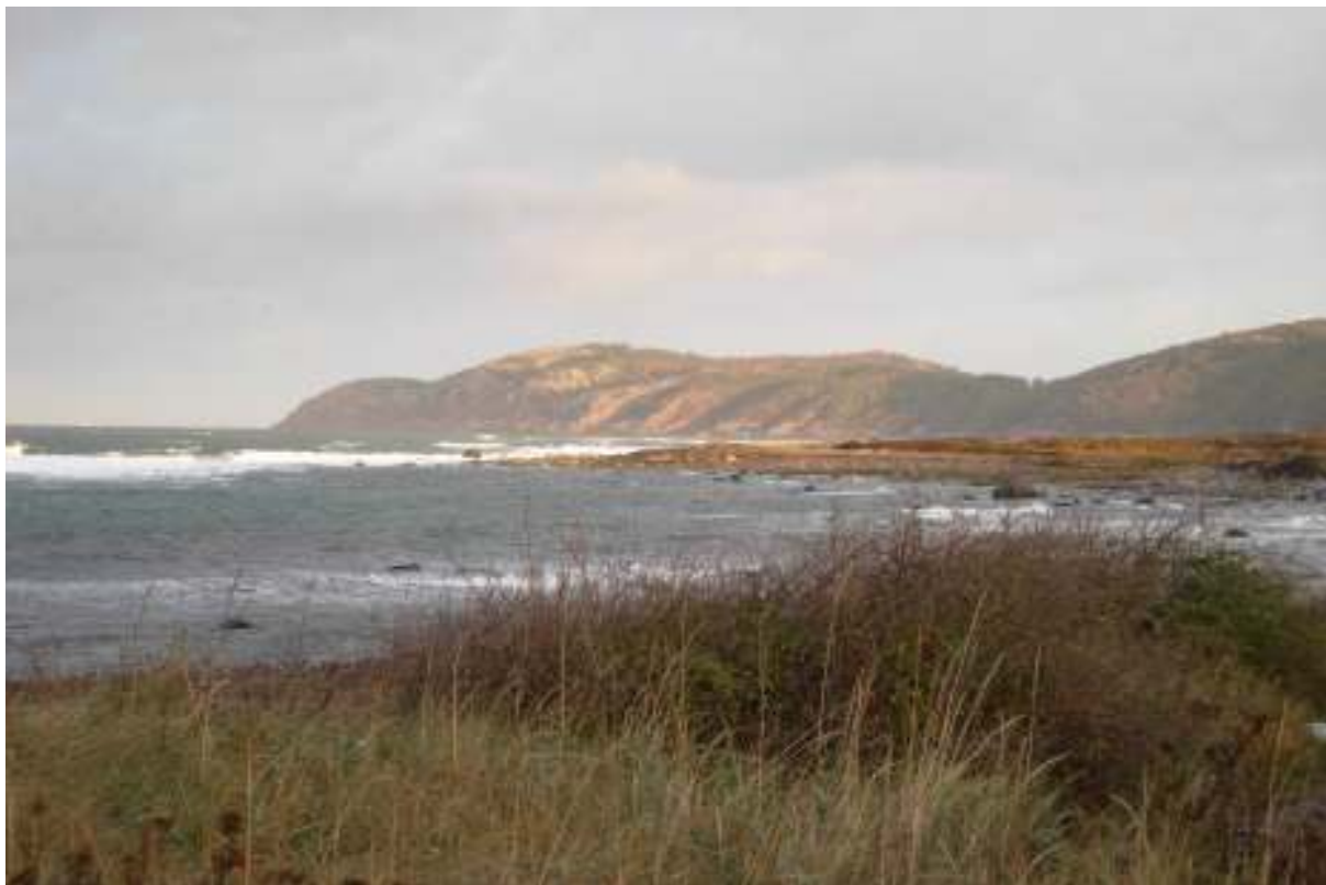
Figur 5. Under sin tid på Krapperup strövade Hildebrand igenom det omgivande landskapet under botaniska exkursioner. Det dramatiska Kullaberg och de ständigt skiftande scenerierna vid kusten fascinerade honom oupphörligen.