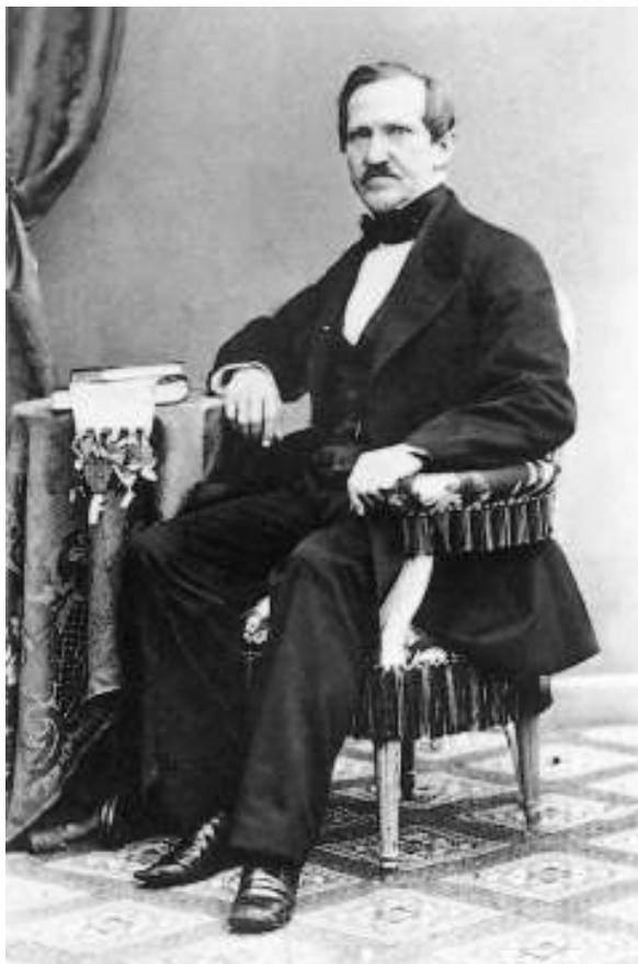
Figur 1. Inga ungdomsporträtt av Hildebrand är kända, så detta fotografi av honom som togs när han stod på livets middagshöjd vid 1800-mitt får förmedla intrycket av hans person. På tidstypiskt sätt omger han sig här av några symbolmättade föremål som visar inom vilken samhällsfär han hade sin gärning, ett par böcker och ett pergamentsbrev med vidhängande sigill.

växande statlig förvaltning, fick kulturarvet successivt en allt större plats i offentligheten, med Hildebrand som central aktör. Under hans ämbetsstid skapades Statens Historiska Museum som vi känner denna institution idag, bland annat genom att de växande arkeologiska föremålssamlingarna fick en plats i den nationalmuseibyggnad som stod färdig i Stockholm 1866.