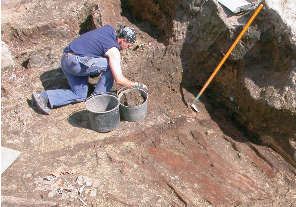
[FIGUR 39] TRÄKÄLLARE UNDER FRAMRENSNING.

så var de olika rummen ofta uppförda i olika material och/eller teknik, vilket snarare innebar att ett hus kompletterades med ett nytt (se Thomasson 1997). Principen om ett rum, ett hus låg kanske bakom skrivningen i donationsbrevet. Byggnaderna var inga färdiga koncept, utan efterhand som nya utrymmen behövdes, tillfördes nya byggnader.