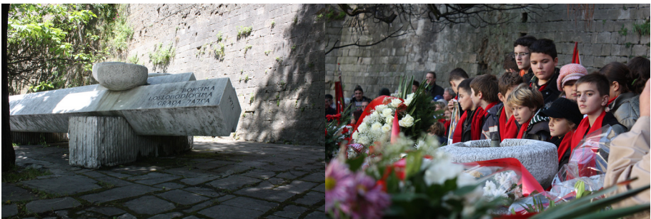
Minnesfontänen dagen före och på minnesdagen av den 29 november.

”Minnesmärket över de fallna kämparna i staden Jajce”, var den första destinationen i dagens minnesceremonier. Det lever annars ett undanskymt liv. Turister som under årens lopp besöker Jajce, stannar inte; inte ens guiderna uppmärksammar det.