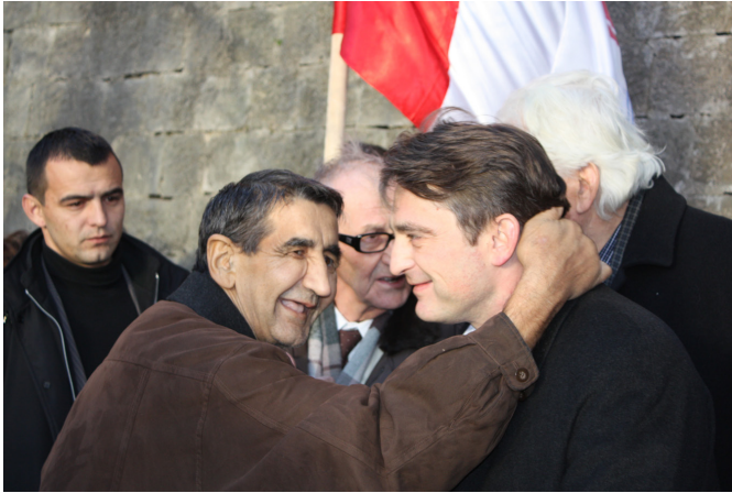
Beundraren och Presidenten.

”Minnesmärket över de fallna kämparna i staden Jajce”, var den första destinationen i dagens minnesceremonier. Det lever annars ett undanskymt liv. Turister som under årens lopp besöker Jajce, stannar inte; inte ens guiderna uppmärksammar det.