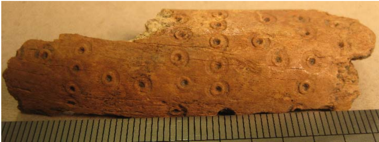
Fig. 2. Ornerat ben från AG1039. Se appendix för närbild.