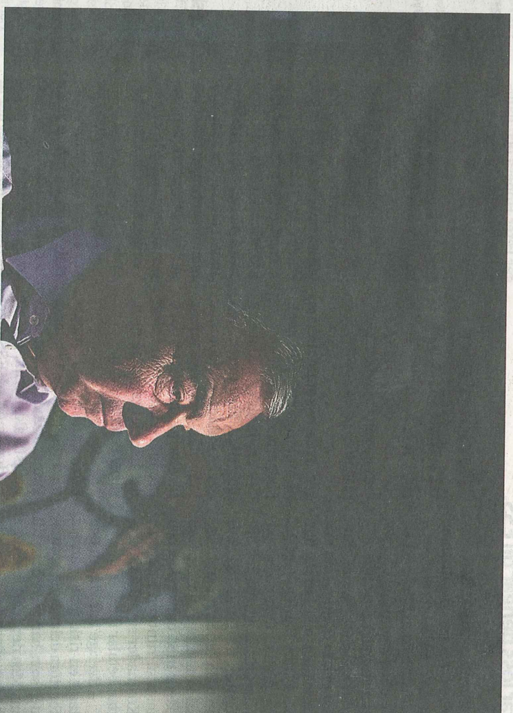
Ett tiotal resor ut i Europa har han gjort för att synhopp ESS-avtal.

nas långt mindre än 30 procent för finansieringen, säger han.