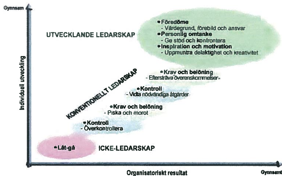
Figur 3. Beskriver olika typer av ledarskapsstilar och deras relation med individuell utveckling och organisatoriska resultat. De ledarskapsstilar som undersöktes i delprojektet representeras av nedersta bubblan (Icke-ledarskap eller passivt ledarskap) och översta bubblan (utvecklande ledarskap). Modellen är hämtad från boken direkt ledarskap (Larsson & Kallenberg, 2006)

Vidare visar studier att olika ledarskapsstilar påverkar säkerhetsklimatet på skilda sätt (se exempelvis Barling, Loughlin & Kelloway, 2002; Kelloway, Mullen & Francis, 2006). I synnerhet tycks den ledarskapsstil som utövas av arbetsledaren ha en stark påverkan på säkerhetsklimatet i arbetsgruppen (Zohar, 2002; Zohar & Luria, 2003; Johnson, 2007). I delprojektet undersöktes relationen mellan säkerhetsklimatet, säkerhetsrelaterade beteenden och två ledarskapsstilar; säkerhetsinriktat utvecklande ledarskap och säkerhetsinriktat passivt ledarskap. I modellen nedan presenteras dessa tillsammans med andra typer av ledarskapsstilar. Ytterligare en faktor som undersöktes i delprojektet var tillit mellan ledare och anställda. Enligt Reason (1997) är tillit mellan ledning och anställda viktig för att anställda ska vara villiga att ta ett eget ansvar för säkerhetsarbetet. Studier har visat att det utvecklande ledarskapet har ett positivt samband med ömsesidig tillit mellan ledare och underställda (Larsson m.fl., 2003).