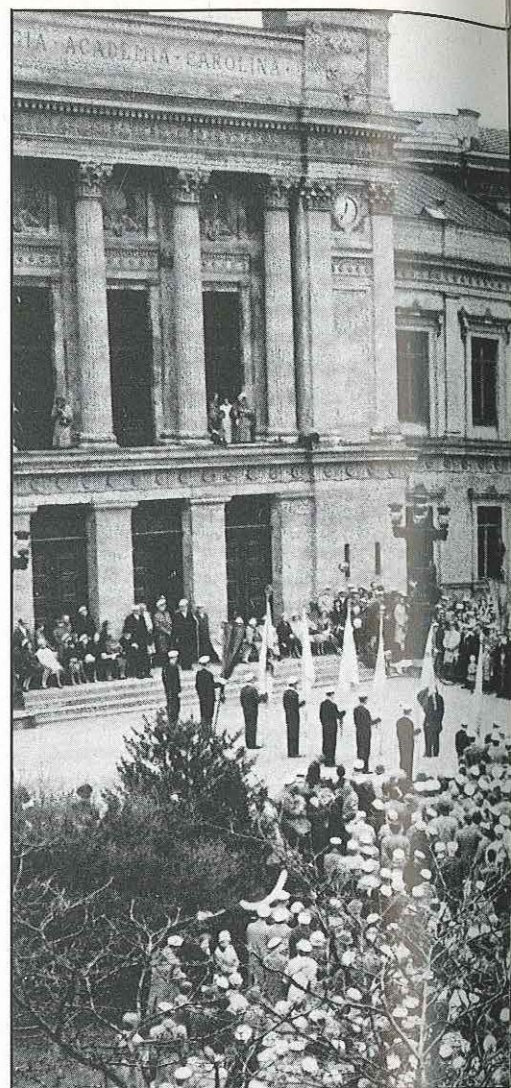
I världskrigets skugga