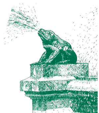
Fakultetsgroda från fontänen på Universitetsplatsen

Illustrationer: Samtliga illustrationer är utförda av Andrzej Szlagor och hämtade från Universitetsplatsen I Lund, en skrift från Informationssekretariatet vid Lunds Universitet