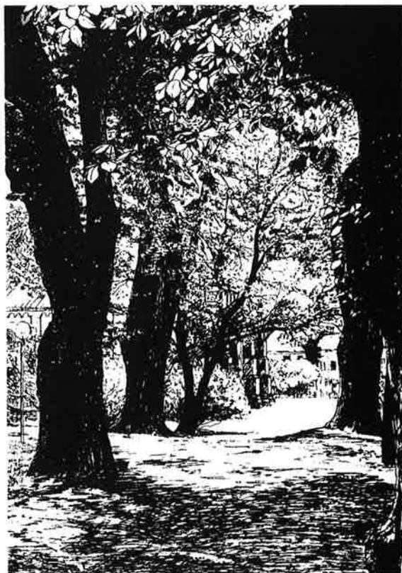
Den s.k. Filosofgången som leder från Lundagårdshuset ned till Domkyrkan

för samhällsklassers och andra sociala krafterns påverkan på den statliga politiken, bl.a. utifrån empiriskt material om den svenska storföretagsamhetens karaktär samt de offentliganställdas position. Genom beslutet om svensk EG-anslutning, den ökade betoningen på marknadskrafter samt inte minst det svenska näringslivets accelererande internationalisering borde svensk samhällsforskning enligt min mening ägna större uppmärksamhet åt detta forskningsområde än vad som är fallet.