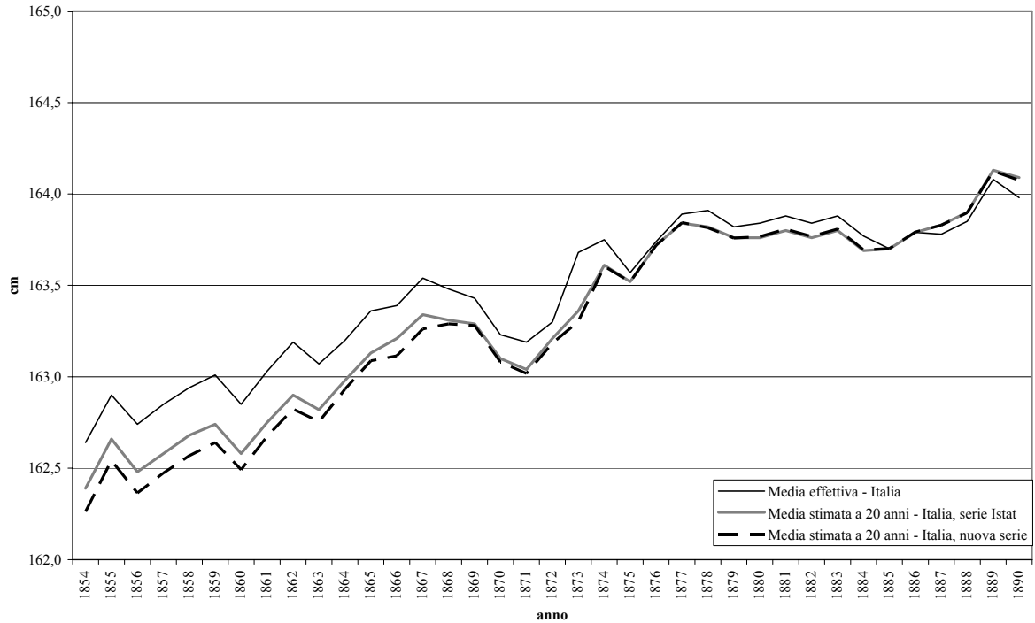
Fig. 4. Statura dei coscritti italiani reale e stimata a 21 anni di età con diversi metodi (classi 1854-1890)